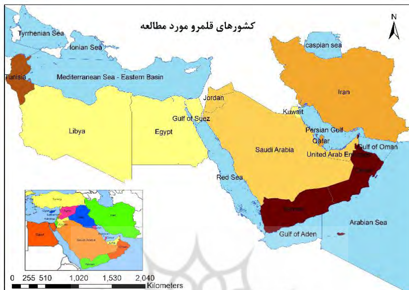
شکل ۲ منطقه جغرافیایی جنوب غرب آسیا و کشورهای حاضر در این منطقه