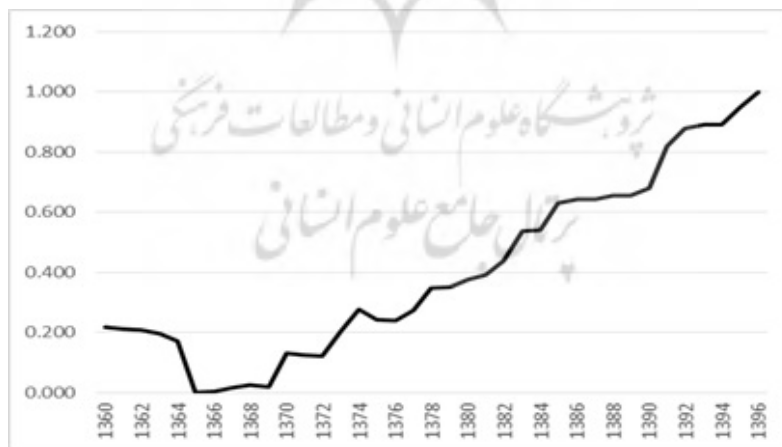
نمودار ۲. روند پولشویی در اقتصاد ایران طی سالهای (۱۳۹۶-۱۳۶۰)

روند تحت تأثیر عوامل مؤثر بر آن قرار دارد که طبق نتایج تخمین مدل، متغیرهای سازنده سازه پولشویی به طور مؤثری روند پولشویی را تحت تأثیر قرار می‌دهند. این متغیرها شامل جرایم سرقت، کشفیات مواد مخدر و دستگیرشدگان مواد مخدر هستند که به ترتیب با ضرایب (۰/۴۰۷)، (۰/۴۸۴) و (۰/۳۸) حجم پولشویی را تحت تأثیر قرار می‌دهند. در میان این عوامل، متغیرهای مرتبط با جرم قاچاق مواد مخدر با شدت بیشتری بر روند پولشویی اثر دارند. بر این اساس درآمدهای ناشی از مبادلات غیرقانونی مواد مخدر ایران منشأ مهم پولشویی در ایران محسوب می‌شوند به نحوی که مجرمان فعال در این حوزه از طریق پولشویی درآمدهای غیرقانونی خود را وارد فعالیتهای رسمی کشور می‌کنند. البته سازه شرایط اقتصادی با متغیرهای درآمد سرانه و فقر نیز بر روند پولشویی اثر دارد؛ به نحوی که کاهش درآمد سرانه واقعی و افزایش فقر در دوره تحت بررسی انگیزه افراد در ورود به فعالیتهای غیر قانونی را تقویت کرده و موجب رشد پولشویی شده است که این یافته با نتایج مطالعات قبلی مطابقت دارد. با این استدلال که بدتر شدن شرایط اقتصادی، مجرمان را تشویق به انجام فعالیتهای غیر قانونی با هدف جبران کمبودهای درآمدی می‌کند. نکته مهم اثر روند پولشویی بر عملکرد اقتصادی کشور است که این موضوع از طریق متغیرهای انعکاس دهنده سازه آثار اقتصادی قابل استنباط است.