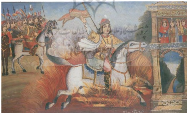
تصویر ۳: گذر سیاوش از آتش. تصویر از کتاب نقاشی قهوه‌خانه (سیف، ۱۳۷۸: ۳۶).

دین در پرده‌خوانی نقش اساسی و مهمی دارد. در این هنر با دو نوع نگاه دینی و معنوی مواجه هستیم: نگاه باستانی که مربوط به قبل از اسلام و مبتنی بر دین زرتشت است و نیز نگاه اسلامی. بینش نخست عموماً در پرده‌خوانی حماسی و بینش دوم در پرده‌خوانی مذهبی دیده می‌شود. البته پرده‌خوانان در موارد بسیاری با مهارت و به‌صورت تحسین‌برانگیزی این دو بینش را به یک‌دیگر نزدیک کرده، تلفیقی معنوی و خاص از آن‌ها به وجود آورده‌اند. چنین تلفیقی بیان‌گر تداوم اندیشه دینی از دین باستانی ایرانیان به دین جدید است. پرده «گذر سیاوش از آتش» نمونه جالبی از این تلفیق است..