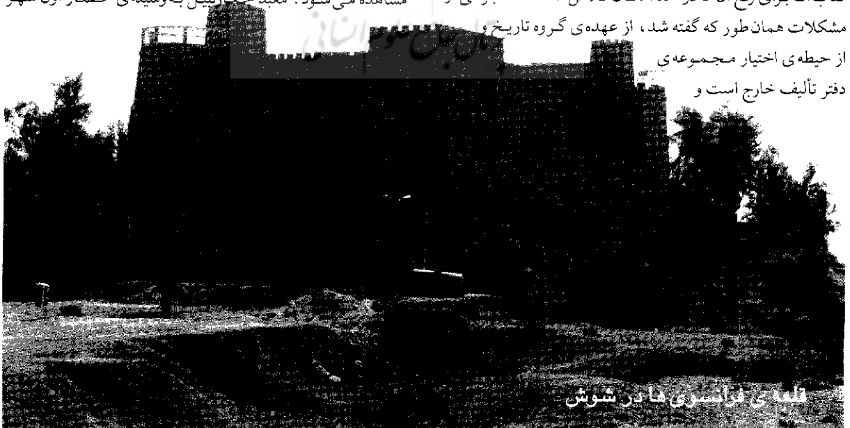
قلعه‌ی فرانسوی‌ها در شوش

از حیطه‌ی اختیار مجموعه‌ی دفتر تألیف خارج است و