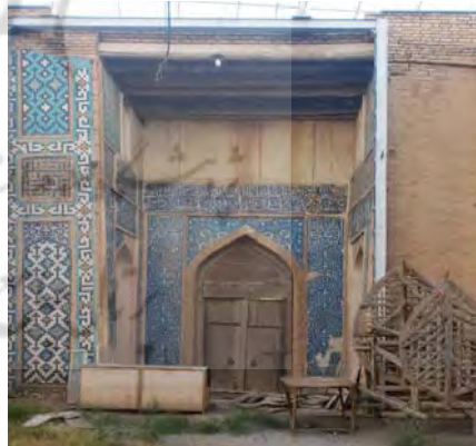
تصویر شماره ۱: سردر دارالسیاده (راست)، جانمایی کتیبه بر سردر دارالسیاده (چپ)