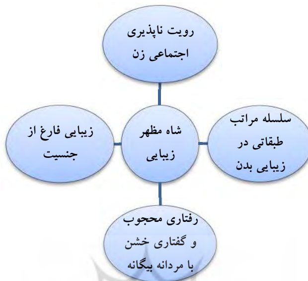
جدول ۱: مفصل بندی گفتمان زیبایی شاهنشاهی

تأثیرات این گفتمان را بر حیات فردی و اجتماعی زنان ایرانی می توان در موارد زیر خلاصه نمود :