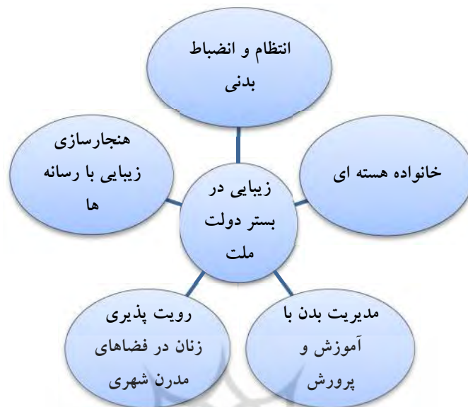
جدول ۳: مفصل بندی گفتمان زیبایی پهلوی

تأثیرات این گفتمان را بر حیات فردی و اجتماعی زنان ایرانی می‌توان در موارد زیر خلاصه نمود: