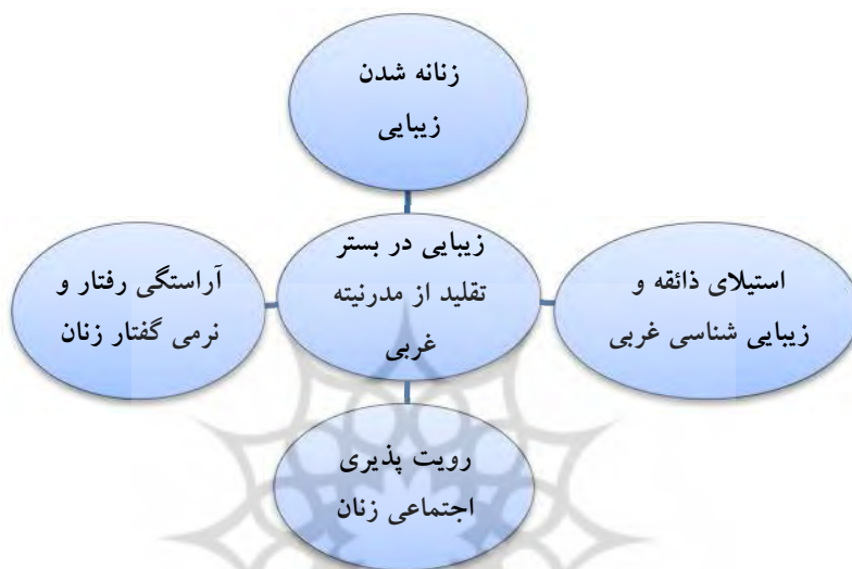
جدول ۲: مفصل بندی گفتمان زیبایی مشروطه

طبقه متوسط و نوظهور شهری در فهم تاریخی برای پاسخگویی به پرسش "ما چرا عقب مانده ایم" راهکار ارتباط با دنیای غرب و اخذ علم و فن از آنها نزدیکترین راه تلقی می شد. اما این اقتباس و ارتباط به تقلید در جنبه های مختلف زندگی اجتماعی از جمله خانواده و زنان و اخذ دال های گفتمان غربی گردید.