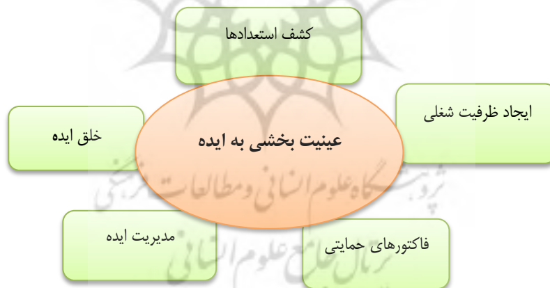
شکل (۱): ارتباط مفاهیم و مقولات معنای قابلیت کارآفرینی