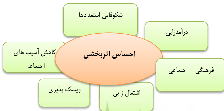
شکل (۳): ارتباط مفاهیم و مقولات پیامدهای قابلیت کارآفرینی