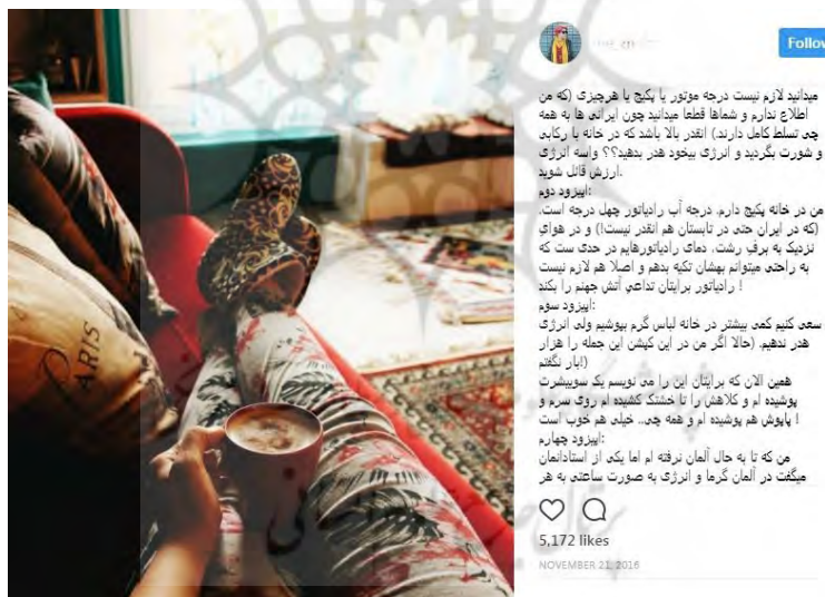
شکل ۴_ بخشی از فعالیت خرده‌سلبریتی‌های سبک زندگی در راستای تأثیرگذاری بر مردم و دعوت آنها به انجام ندادن رفتارهایی است که زشت و غیر متمدن تلقی می‌شوند. به‌عنوان مثال یکی از خرده‌سلبریتی‌های مورد مطالعه، در پست بلند بالایی که ۲۱ نوامبر ۲۰۱۶ منتشر کرد، تصویری از پاهایش با پوششی گرم را به نمایش گذاشت و از ضرورت صرفه‌جویی در مصرف انرژی نوشت.