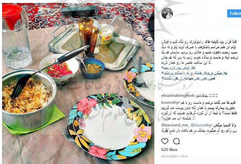
شکل ۱. سفره ساده و بی‌آلایش خرده‌سلبریتی

در صفحه «پزشک خوش‌قلم»، هیچ مانعی بر سر راه انتشار تصویری از یک بخاری برقی قدیمی و کهنه که پاپیون دانشجویان پزشکی را گرم نگه می‌دارد، وجود ندارد. در واقع، این عادت برخی خرده‌سلبریتی‌هاست که بگویند زندگی، همیشه به اصطلاح «گل و بلبل» نیست و آنها هم انسان‌هایی عادی هستند.