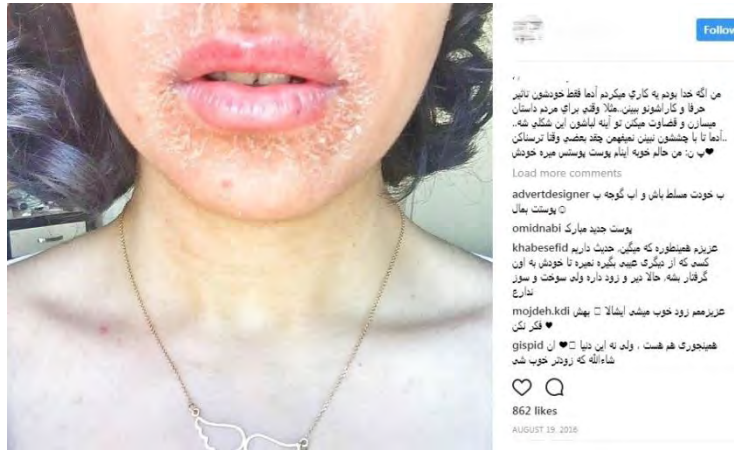
شکل ۳_ مهم‌ترین و عجیب‌ترین نمود واقعی بودن را می‌توان در یکی از پوست‌های یکی از خرده‌سلبریتی‌های مورد مطالعه دید که با صورتی نازیبا، درحالی‌که دور لبانش پوسته پوسته شده بود و از زاویه نزدیک از خودش سلفی انداخته است