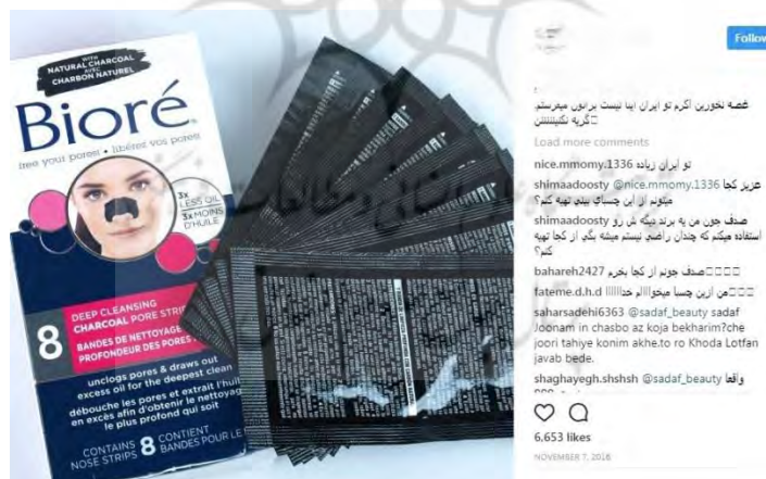
شکل ۲_ خرده‌سلبریتی‌ها معمولاً چیزی را تبلیغ می‌کنند که خودشان تجربه استفاده از آن را داشته‌اند (حداقل این‌طور وانمود می‌کنند)

اعتماد، مهم‌ترین سرمایه‌ای است که نه‌تنها خرده‌سلبریتی‌ها، بلکه متخصصان بازاریابی نیز به‌خوبی قدرش را می‌دانند. آنها می‌توانند با بازاریابی از طریق اینفلوئنسرها ۱ خرده‌سلبریتی‌های مورد نظر خود را پیدا کرده و به کمک روابط اطمینان‌بخشی که میان او و دنبال‌کنندگان در جریان است، کالا یا خدمت مورد نظر خود را راحت‌تر به مشتریانشان بقبولانند. امروز سرنوشت خرده‌سلبریتی‌های اینستاگرامی با نظام تبلیغات و بازاریابی، گره خورده است؛ افراد معمولی می‌توانند با تکیه بر برخی تکنیک‌های مشخص و در مدتی کوتاه، به جایگاهی دست پیدا کنند که بتوانند بر تصمیمات دنبال‌کنندگان تأثیرگذار باشند.