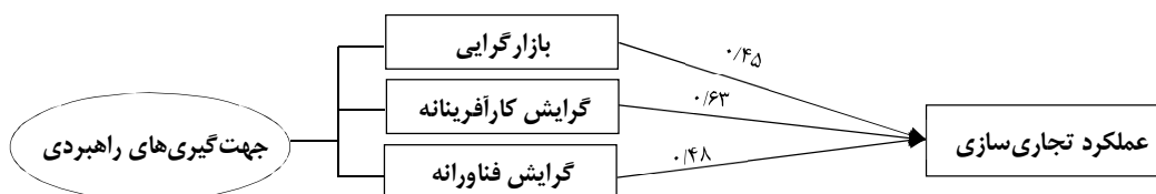
شکل 3. ضرایب مسیر مدل فرضیه‌های فرعی پژوهش

جهت‌گیری راهبردی یعنی بازارگرایی، گرایش کارآفرینانه و گرایش فناورانه به‌عنوان سازه‌های برون‌زا و عملکرد تجاری‌سازی محصولات جدید ورزشی به‌عنوان سازه درون‌زا ترسیم گردید و توسط نرم‌افزار اجرا شد. خروجی به‌دست آمده از اجرای این مدل شامل ضرایب استاندارد شده و ضرایب معناداری است که نتایج آن در شکل 3 و جدول 2 قابل مشاهده می‌باشد.