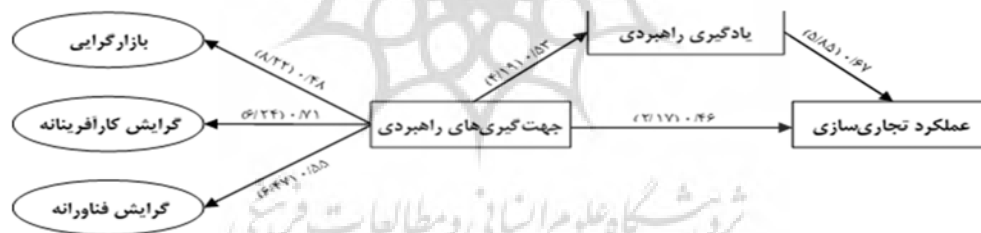
شکل ۲. ضرایب مسیر و معناداری مدل مفهومی پژوهش

با توجه به سه مقدار 0/01، 0/25 و 0/36 که به ترتیب به عنوان مقادیر ضعیف، متوسط و قوی برای نیکویی برازش معرفی شده است، شاخص برازش مطلق طبق فرمول بالا مقدار 0/54 به‌دست آمد که برازش بسیار مناسب مدل کلی پژوهش را نشان می‌دهد.