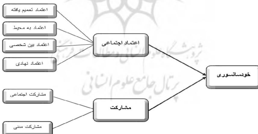
شکل ۱. مدل نظری تحقیق