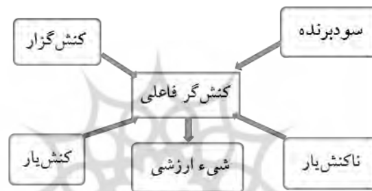
نمودار (۱): الگوی کنش‌گران گرمس

از نظر گرمس، سه کارکرد پایه‌ی روایت پیمان، آزمون و داوری است و روایت هنگامی کامل می‌شود که نقش‌های متعهد پیمان، آزمون‌شونده و مورد داوری به یک فاعل واحد برسد که همان قهرمان قصه است (همان: ۱۵۶-۱۵۵). در نمودار (۱)، می‌توان الگوی کنش‌گران گرمس را مشاهده کرد.