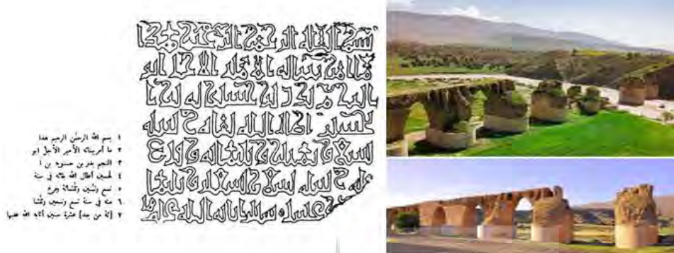
تصویر ۱: نمای جنوبی پل تاریخی کشکان و کتیبه دوره اسلامی مربوط به آن (منبع: نگارندگان، ۱۳۹۶).

اما با توجه به آزمایشات سالیانی که در پژوهشکده مرمت اشیاء سازمان میراث فرهنگی ایران در سال ۱۹۹۹ میلادی انجام شده عمر این اثر تاریخی ۱۰۶۰ سال با تلورانس ۲۰ سال تعیین شده است که نشان دهنده بازسازی پل در قرن چهارم هجری است (سجادی، ۱۳۹۳: ۸۷).