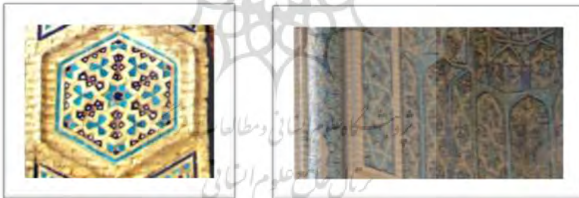
تصویر ۹: شمسه هشت پر با آجر معقلی در سردر شمالی مسجد، (ب) شمسه پنج پر در زیر نمای ایوان جنوبی مسجد جامع ورامین

نقش هشت ضلعی و شمسه (تصویر ۹) در ایوان جنوبی و سردر مسجد جامع ورامین به وفور بکار رفته است که در هنر اسلامی دارای معانی و مفاهیم فراوانی است از جمله به عنوان نماد الوهیت و نور وحدانیت بکار می رود (خزایی، ۱۳۲: ۱۳۸۱).