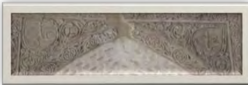
تصویر ۱۶: کتیبه با نام محمد (ص) و علی (ع) (منبع: نگارندگان)

تصویر ۱۵: کتیبه با نام الله (منبع: نگارندگان)