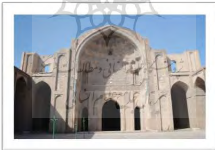
تصویر ۵: ایوان جنوبی مسجد جامع ورامین.

ایوان مرتفع جنوبی (تصویر ۵) و گنبد خانه ی مقصوره پشت آن محور شمالی- جنوبی قدرتمندی را ایجاد کرده است که ضمن تاکید بر جهت قبله بیشترین آرایه های مسجد را در این محور می توان مشاهده کرد (تصویر ۶).