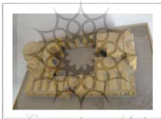
تصویر ۳: ماکت مسجد جامع ورامین

بنا بر کاوش هایی که در شبستان غربی مسجد بین سال های ۱۳۴۵-۵۴ انجام گرفت، شواهدی بدست آمد که احتمالاً به علت سیل قسمت هایی از مسجد به ویژه جبهه غربی تخریب گردیده است (فرحانی، ۱۳۸۱: ۴۴). بنابراین این آسیب ها باعث از دست رفتن دو مناره، و بخشی از رواق های غربی شده است که در سال های اخیر در نتیجه کاوش های باستان شناسی برخی از پایه های ضخیم آن از دل خاک بیرون آورده شده است (شیبانی و همکاران، ۱۳۶۵: ۴۹). در سال های اخیر سازمان میراث فرهنگی به مرمت و بازسازی قسمت های مختلف از بین رفته پرداخته است. بخش های مرمت شده همان قسمت هایی هستند که در فاصله زمانی بین اواخر دوره تیموری تا زمان مرمت آن ها به تدریج تخریب شده بودند (شیبانی، ۱۳۶۵: ۴۷-۵۰). بدین ترتیب وضعیت کنونی مسجد شامل اطراف میانرای مربع شکل آن که حوضی در میان دارد چهار ایوان به همراه رواق های، (تصویر ۳)