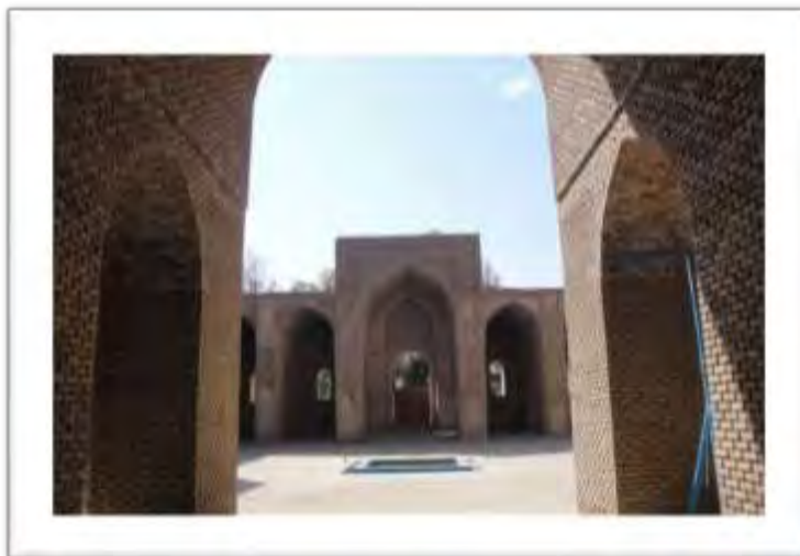
تصویر ۷: ایوان شرقی مسجد جامع ورامین