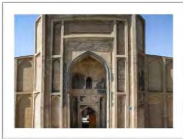
تصویر ۴: سردر شمالی مسجد جامع ورامین (منبع: نگارنده گان).

ایوان مرتفع جنوبی (تصویر ۵) و گنبد خانه ی مقصوره پشت آن محور شمالی- جنوبی قدرتمندی را ایجاد کرده است که ضمن تاکید بر جهت قبله بیشترین آرایه های مسجد را در این محور می توان مشاهده کرد (تصویر ۶).