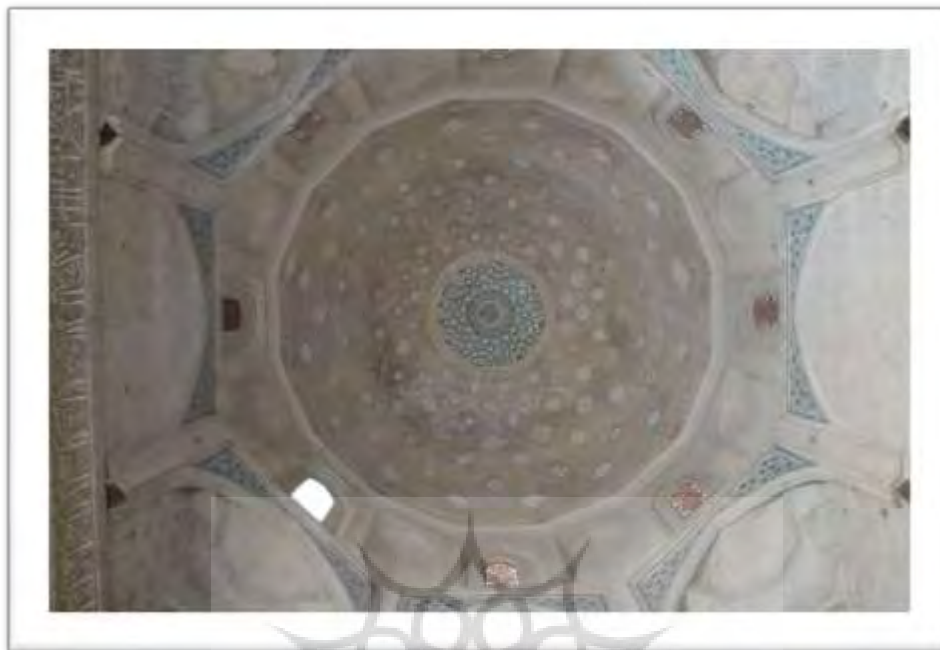
تصویر ۶: تزئینات گنبد خانه مقصوره (منبع: نگارندگان)

ایوان غربی، ایوان شرقی و ورودی غربی مسجد کم ارتفاع و دارای آرایه های کمتری است (تصویر ۷). در سفر نامه دیولافوا به پوسته مینایی خارج گنبد مسجد اشاره شده که در حال حاضر اثری از آن مشاهده نمی شود (دیولافوا، ۱۳۹۰: ۱۶۴). از نمونه های مساجد شاخص که قابل مقایسه با مسجد ورامین است می توان مسجد جامع زواره را نام برد (ویلبر، ۱۳۶۵: ۱۷۰).