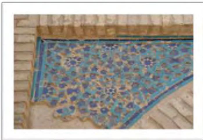
تصویر ۸: آرایه های هندسی همراه یا هنر آجر کاری و کاشی کاری (منبع: نگارندگان)

نقش هشت ضلعی و شمسه (تصویر ۹) در ایوان جنوبی و سردر مسجد جامع ورامین به وفور بکار رفته است که در هنر اسلامی دارای معانی و مفاهیم فراوانی است از جمله به عنوان نماد الوهیت و نور وحدانیت بکار می رود (خزایی، ۱۳۲: ۱۳۸۱).