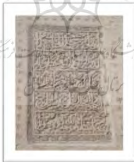
تصویر ۲: کتیبه ایوان جنوبی مسجد جامع ورامین

کتیبه سر در مسجد تاریخ ۷۲۲ و کتیبه زیر گنبد سال ۷۶۵ ه.ق را نشان می دهد (کیانی، ۱۳۶۸: ۲۳۷). مسجد در زمان الجایتو به بنایی حکومتی که تحت تاثیر تفکرات شیعی حاکمان بود تبدیل شد. این مسجد در گذر زمان از گزند حوادث روزگار مصون نبوده و بارها تخریب شده و دوباره مرمت شده است، از جمله در کتیبه ای در ایوان جنوبی شرح تعمیرات شاهرخ تیموری آورده شده است (تصویر ۲).