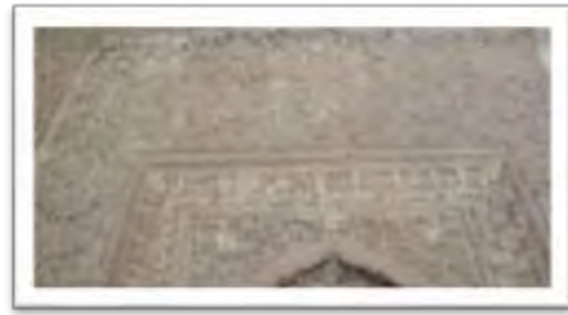
تصویر ۱۳: آجرهای مهری با نقش ماهی ی گیاهی در دیوار گنبد خانه به