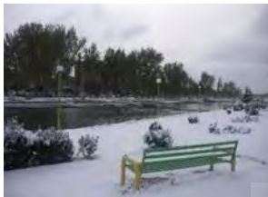
تصویر ۴- شهر زمستانی اردبیل

با توجه به مطالب فوق و شرایط جوی و هوای استان اردبیل، طراحی فضاهای سبز گسترده روباز در شهرستان اردبیل که اقلیم سردی دارد، متناسب فصل‌های سرد سال که بیشتر از تعداد روزهای گرم سال است، نیست. با این حال شهر نیاز به فضای سبز و درختکاری دارد. درخت علاوه بر ایجاد نشاط و زیبایی بصری عامل دفع بادهای مزاحم نیز می‌باشد. اما درختکاری نمی‌تواند عامل دفع هوای سرد و سوز ناشی از برف شود و فضاهای باز نمی‌تواند عامل رفع نیازهای مردم در روزهای برفی سال باشد. با توجه به اقلیم اردبیل، شهر نیازمند فضای سرپشته و با دمای کنترل شده در زمستان جهت گردهمایی و تفریح می‌باشد. فضای بدور از باد و جریان‌های بارشی. تصاویر شماره ۲، ۳ و ۴ نشان دهنده چهره زمستان در اردبیل در فصول سرد سال است.