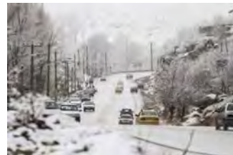
تصویر ۲- شهر زمستانی اردبیل (نگارندگان؛ ۱۳۹۸)