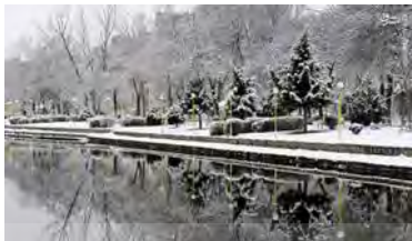
تصویر ۳- شهر زمستانی اردبیل (نگارندگان؛ ۱۳۹۸)