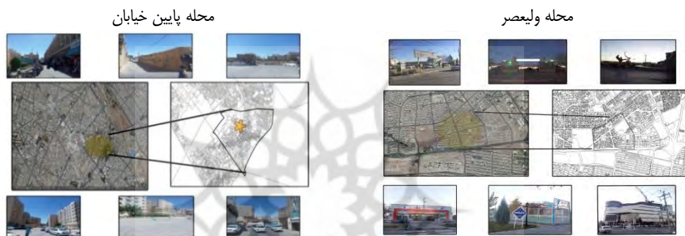
شکل ۱- معرفی محلات

ابتدا به جمع آوری اطلاعات از کتب مختلف در رابطه با محله، نوشهرگرایی، شهرهای اسلامی و شهرسازی ایرانی اسلامی پرداخته شده است. همچنین استفاده از اینترنت و سایت های معتبر داخلی و خارجی پرداخته شده است در این راستا به منظور گردآوری داده ها از مشاهدات میدانی، بازدید سایت استفاده می شود علاوه بر روش کتابخانه ای از روش میدانی نیز در گردآوری اطلاعات استفاده شده است که از طریق مشاهده و بازدید از سایت (محله پایین خیابان و محله ولیعصر) و بررسی زیرمعیارهای مربوطه به اصول شهرسازی اسلامی و اصول نوشهرگرایی پرداخته شده است. علاوه بر مطالعات میدانی و تحلیل اصول شهرسازی اسلامی و مقایسه تطبیقی با اصول نوشهرگرایی در محلات عکس هوایی تهیه شده و به بررسی ویژگی های محله بر اساس شهرسازی ایرانی اسلامی و نهضت نوشهرگرایی پرداخته شده است.