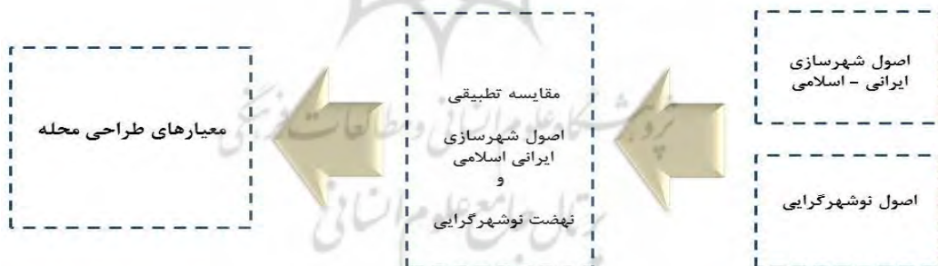
شکل ۲- روند مطالعه و دستیابی به معیارهای مقایسه تطبیقی شهرسازی ایرانی و اسلامی و نوشهرگرایی