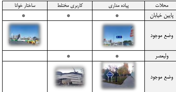
جدول ۳ و ۴- تحلیل معیارهای مستخرج از مقایسه تطبیقی

به منظور تحلیل اطلاعات در ابتدا تصاویر تهیه شده از محلات از طریق آمار توصیفی مورد تحلیل قرار گرفتند و سپس با بررسی های میدانی به تحلیل معیارهای مستخرج از مقایسه تطبیقی در سطح محلات مختلف پرداخته شد.