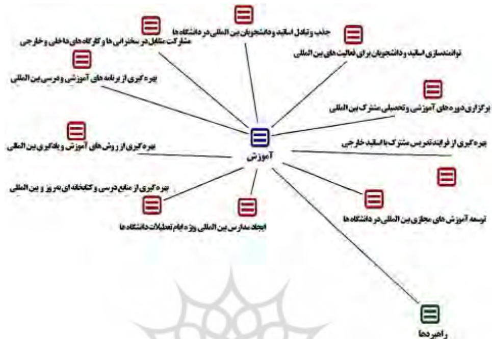
شکل ۱. مقوله‌های اصلی و فرعی مربوط به راهبردهای بخش آموزش

۲) راهبردهای ارتقای بین‌المللی شدن دانشگاه‌های دولتی منتخب کشور در حوزه پژوهش، کدام است؟