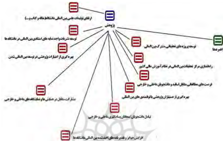
شکل ۲. مقوله‌های اصلی و فرعی مربوط به راهبردهای بخش پژوهش

از بابت بالا بردن بین المللی شدن دانشگاه‌ها بلکه به خاطر دلایلی که عنوان شد بیش از پیش اهمیت دارد.» در ادامه شکل خروجی آن ارائه شده است.