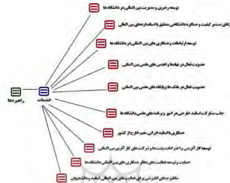
شکل ۳. مقوله‌های اصلی و فرعی مربوط به راهبردهای بخش خدمات

در ادامه، الگوی تجمیع‌شده راهبردهای سه‌گانه بین‌المللی شدن دانشگاه‌های منتخب دولتی کشور در قالب سه مؤلفه اصلی راهبردها اعم: آموزش، پژوهش و خدمات هر کدام مشتمل بر ۱۰ مؤلفه فرعی مجموعاً ۳۰ مؤلفه و ۳۳۵ کدباز ارائه شده است. شکل ۴ نمایانگر خلاصه ساختار، کارکرد و الزامات تحقق راهبردهای بین‌المللی شدن دانشگاه‌های منتخب دولتی کشور است که بر اساس مطالعه و بررسی مبانی نظری و تحلیل متن مصاحبه‌ها است.