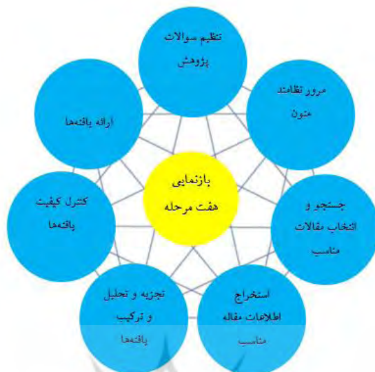
نگاره ۱. بازنمایی هفت مرحله راهبرد سندلوسکی و باروسو

در گام اول: تنظیم سوالات پژوهش بود. بنابراین پرسش نخست پژوهش، تحلیل هزینه و فایده در نظام‌های آموزشی از چه مقوله‌ها و مفاهیمی تشکیل شده‌است؟ مطرح شد. در گام دوم: مرور نظام‌مند متون بود. بنابراین در این پژوهش جامعه آماری را تمام اسناد علمی، گزارش‌های پژوهشی، پایگاه‌های داده‌ها و نشریه‌های داخلی در زمینه تحلیل هزینه و فایده در نظام آموزش عمومی و عالی در طی سال‌های ۱۳۷۱-۱۳۹۸ تشکیل می‌دهند که با به کارگیری واژه‌های کلیدی متنوع تحقیق از جمله؛ تحلیل هزینه فایده، هزینه منفعت، نرخ بازده، نرخ بازده خصوصی، نرخ بازده مورد انتظار در پایگاه‌های اطلاعاتی مگیران، انسانی، نورمگز گردآوری شدند. نتیجه این جستجو، ۴۳ پژوهش مرتبط بود. در گام سوم جستجو و انتخاب پژوهش‌های مناسب بود. در این مرحله پس از بررسی مقالات در سه پارامتر [عنوان، چکیده و متن مقالات] پژوهش‌های مناسب ارزیابی و گزینش شدند. این فراگرد در نگاره (۲) تشریح شده‌است.