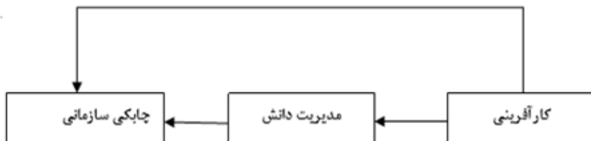
شکل ۲- مدل مفهومی تحقیق

هم‌چنین این که نتیجه‌گیری در زمینه ارتباط کارآفرینی با چابکی با واسطه‌گری مدیریت دانش نیازمند تحقیقات گسترده است و بررسی پیشینه پژوهش‌های انجام شده نشان می‌دهد کمتر انجام گرفته است؛ پژوهش حاضر به دنبال رفع کمبودهای پژوهشی موجود به دنبال پاسخگویی به این سوال است که آیا مدیریت دانش نقش میانجی‌گری معنادار بین کارآفرینی سازمانی و چابکی سازمانی در استادان دانشکده فنی پسران مرودشت ایفا می‌کند.