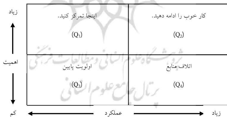
شکل 1. ماتریس عملکرد-اهمیت [31]

ماتریس تجزیه و تحلیل عملکرد-اهمیت، برای اولین بار به وسیله مارتیلا و جیمز 1 (1977) ارائه شد [31]. فرض اساسی در روش تحلیل عملکرد - اهمیت این است که سطوح رضایت مشتری از مؤلفه‌ها یا معیارهای 2 مورد نظر سازمان، تحت تأثیر انتظارات و قضاوت‌های مشتریان در خصوص عملکرد سازمان است. برای انجام تجزیه و تحلیل لازم است سطوح عملکرد و درجه رضایت از هر مؤلفه (معیار) براساس داده‌های گردآوری شده مشخص شود. این روش به سازمان‌ها کمک می‌کند تا با بررسی عدم برابری بین عملکرد-اهمیت، شکاف‌ها را شناسایی کنند. عمده‌ترین ابزار در این مدل، ماتریس IPA است. در واقع نقش اساسی این ماتریس، کمک به فرایند تصمیم‌گیری با در نظر گرفتن چهار ناحیه تصمیم برای تعیین اولویت مؤلفه‌ها با هدف بهبود یا ارتقا است [32]. براساس ابعاد «اهمیت» و «عملکرد» چهار ناحیه در ماتریس مشخص می‌شود که در شکل 1 نشان داده شده است: