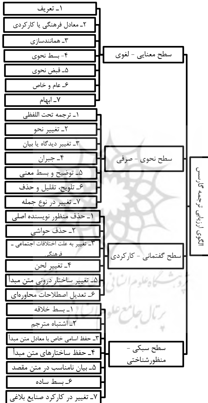
شکل ۱: الگوی کارمن گارسس (گارسس، ۱۹۹۴: ۸۱-۸۳)