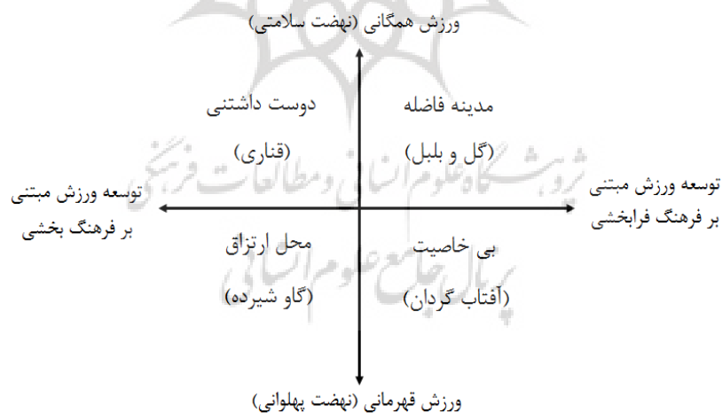
شکل ۳. سناریوهای مرتبط با آینده ورزش (پدیدآورنده)

نکته اساسی این است که با تحلیل علی لایه ای موضوع فلسفه ورزش در دین اسلام به این موضوع پی خواهیم برد که اولاً چرایی و دلیل پرداختن به ورزش غالباً مربوط به دو سطح فوقانی این تحلیل است و ثانیاً برخی از دلایلی که بطور آشکار و با تحلیل سطحی می‌توانند به‌عنوان عوامل اصلی مشارکت در ورزش از نظر دین اسلام باشند با نگاه عمقی و رفتن به سطوح سوم و چهارم تحلیل می‌توان پی برد که نبوغ جامعه و احساس نیاز به فعالیت بدنی که حاصل سطح گفت‌وگو و جهان بینی و استعاره‌ها در جهان اسلام است، جامعه را بیشتر و بهتر به سوی مشارکت همگانی در ورزش سوق می‌دهد نمونه بارز این امر ذهن آگاه و خلاق و فرهنگ غنی افراد تحصیل کرده در درون جامعه اسلامی است که به فعالیت بدنی به‌عنوان یک نیاز می‌نگرند، سطوح لیتانی و اجتماعی موجب تقویت سطح گفت‌وگو سازی و جهان بینی افراد جامعه از اهمیت و ضرورت فعالیت بدنی در سبک زندگی شده و موجبات تقویت و ورود افراد به ورزشگاه‌ها، پارک‌ها می‌شود. بدین ترتیب مزیت فعالیت بطور رسمی و ضمنی پذیرفته می‌شود که خود مشوق اقشار جامعه برای مشارکت در فعالیت بدنی است. علاوه بر آن بسیاری از پدیده‌های دیگر محیطی از قبیل رسانه‌ها، متخصصین و نخبگان ورزشی، موجب تقویت اسطوره‌ها، استعاره‌ها و جهان بینی در راستای مشارکت حداکثری جامعه در ورزش خواهد بود.