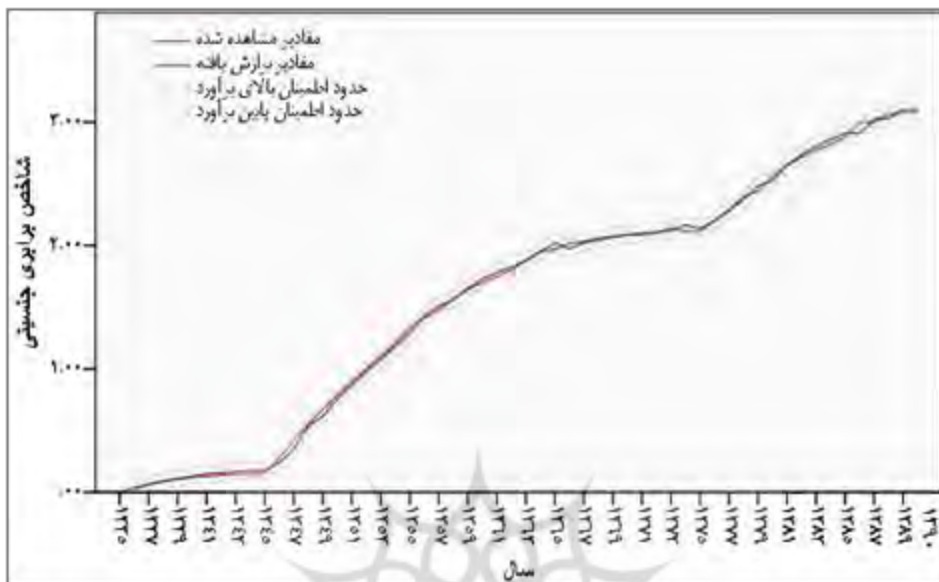
نمودار ۳. مقادیر مشاهده و پیش‌بینی شده به همراه حدود اطمینان برآورد برابری جنسیتی (مدل آریمای نهایی)