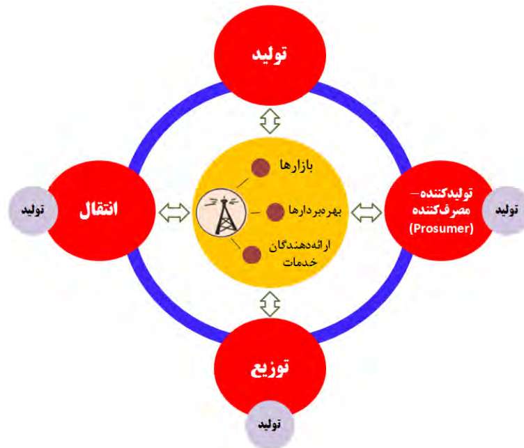
شکل ۱: مفهوم شبکه هوشمند برق‌رسانی (نشان‌دهنده ارتباطات فیزیکی و مخابراتی) (Ribeiro et al., 2012)

دوسویه انرژی را فعال می‌کنند. بنابراین، با توجه به ماهیت دوسویه شبکه هوشمند برق‌رسانی، مشارکت طرف مصرف‌کننده در اجرا و پیاده‌سازی آن حیاتی و اجتناب‌ناپذیر است. به طوری که بدون مشارکت فعال طرف مصرف‌کننده، شبکه هوشمند محقق نمی‌شود و ارتباط دوسویه شکل واقعی به خود نمی‌گیرد. برای همین، در شبکه هوشمند به جای واژه «مصرف‌کننده» ۲ از واژه «تولیدکننده - مصرف‌کننده» ۳ استفاده شده که ترکیب دو واژه تولیدکننده و مصرف‌کننده است و دلالت بر این دارد که مصرف‌کننده می‌تواند نقش تولیدکننده را نیز ایفا کند (Fang et al., 2012; Lo and Ansari, 2012; Bigerna et al., 2016; Kabalci, 2016; Nafi et al., 2016).