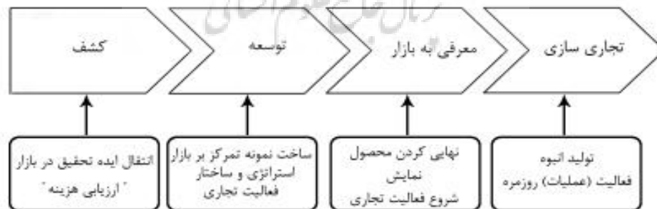
شکل شماره ۲: فرآیند تجاری سازی فناوری (رادفر و همکاران، ۱۳۸۸)

مطابق شکل ۲ تجاری کردن، فرآیندی است که از طرح کردن و پروردن یک ایده آغاز می شود و به توسعه ایده به سمت تولید (کالا، محصول) و در نهایت فروش آن به مشتری (صنعت/استفاده کننده نهایی) می انجامد.