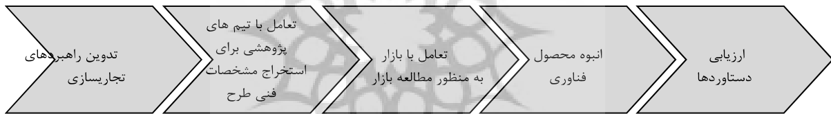
شکل شماره ۱: مدل پیشنهادی فرآیند تجاری سازی فناوری (موسایی و همکاران، ۱۳۸۷)

به منظور ایجاد یکپارچگی و هماهنگی های لازم بین فرایندها و فعالیت های به بازار رسانی و نیز ارتقای موفقیت تجاری سازی محصولات از جنس فناوری، نیاز به یک مدل تجاری سازی ضروری به نظر می رسد. در حال حاضر مدل های محدودی به منظور تجاری سازی علم و فناوری ارائه شده است. که در زیر به برخی از آنها اشاره شده است. مهم ترین نقدی که بر مدل های مذکور وارد است، فقدان یکپارچگی مراحل مختلف می باشد. به عبارت دیگر یکپارچگی مناسبی بین راهبردهای سازمان، گروه های درگیر در فرآیند توسعه و تجاری سازی فناوری، تلفیق دانش های مدیریتی و مهندسی، درک نیازهای بازار و از این قبیل کمتر مشاهده می شود. در مدل ارائه شده تلاش شده تا تمامی عوامل تأثیرگذار بر به بازاریابی فناوری مورد شناسایی قرار گیرد. همان طور که در شکل شماره ۱ نشان داده شده فرایند کلان تجاری سازی فناوری شامل پنج مرحله اصلی که عبارتند از: تدوین راهبردهای تجاری سازی؛ تعامل با تیم های پژوهشی برای استخراج مشخصات فنی طرح؛ تعامل با بازار به منظور مطالعه بازار؛ انبوه محصول فناوری؛ ارزیابی دستاوردها؛ مطالعه بازار؛ تولید انبوه محصول فناوری؛ ارزیابی دستاوردها و انجام اصلاحات (موسایی و همکاران، ۱۳۸۷)