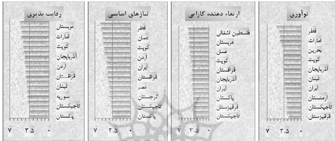
نمودار ۱. نمودارهای مؤلفه‌های ۳ گانه رقابت پذیری در کشورهای منطقه مورد اشاره در سند چشم‌انداز