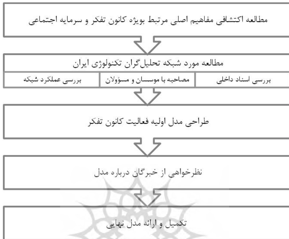
شکل ۱. شیوه استفاده از موردکاوی در طراحی سیستم بهینه جلب آرای عامه از طریق کانون‌های تفکر برای توسعه خط‌مشی‌گذاری