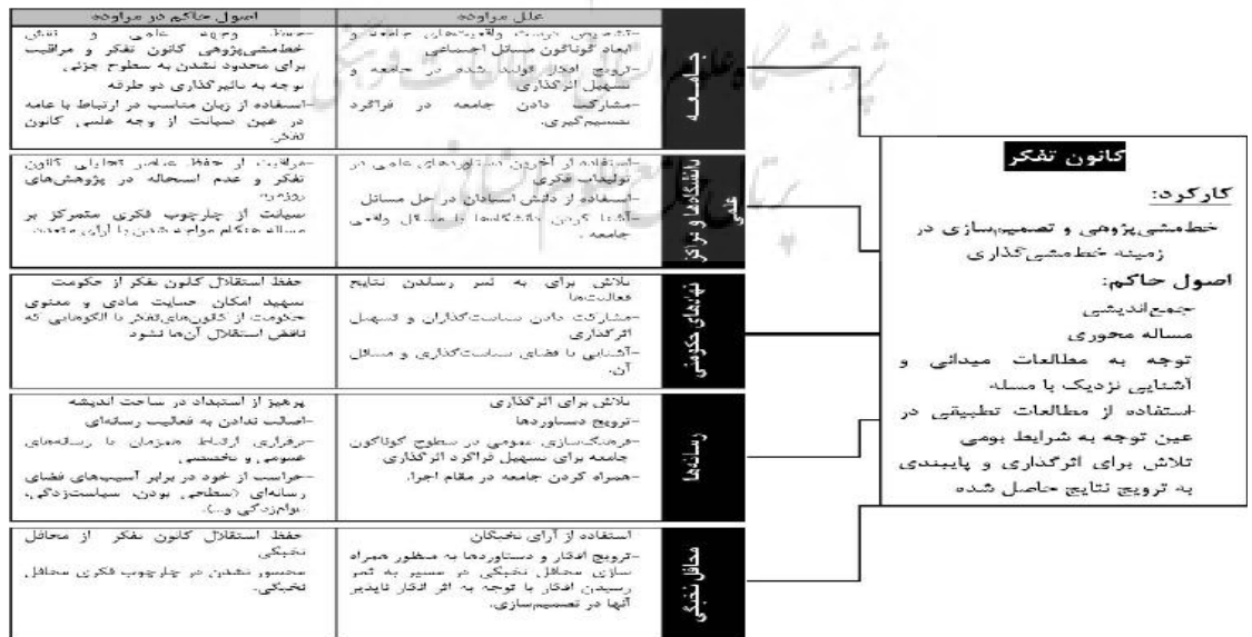
شکل ۳. چهارچوب روابط و اصول حاکم بر آن برای ایفای نقش کانون تفکر به عنوان حلقه واسط بین مردم و حکومت

یکی از مأموریت‌های کانون تفکر، ترویج دستاوردها و راهکارها و پیگیری اجرای اثربخش آنهاست. این مأموریت همچون رابطه با نهادهای حاکمیتی از اهمیت تأثیرگذاری تلاش‌های کانون تفکر در تصمیم‌سازی‌ها ناشی می‌شود. بدین منظور کانون‌های تفکر باید ارتباط سازمان‌یافته‌ای را با رسانه‌های عمومی برقرار کنند. در این مراوده باید ایده‌های حاصل شده در کانون‌های تفکر، در سطوح گوناگون اجتماعی ترویج شوند؛ ضمن این‌که از طریق فرهنگ‌سازی در افکار عمومی، زمینه همراه ساختن جامعه با ایده‌های جدید فراهم آید. البته در این ارتباط باید مراقب بود تا فعالیت رسانه‌ای برای کانون تفکر اصالت پیدا نکند و کانون تفکر دچار آسیب‌های رسانه‌های عمومی نظیر سطحی بودن، سیاست‌زدگی و عوام‌زدگی نشود. همچنین علاوه بر رسانه‌های عمومی، ارتباط با رسانه‌های تخصصی نیز باید در دستور کار کانون‌های تفکر باشد.