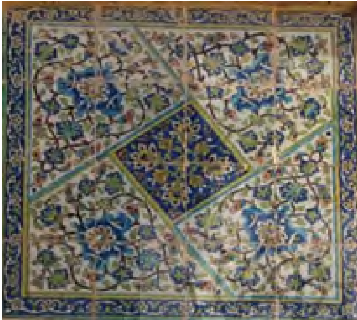
تصویر ۱۴: سومین قاب کاشیکاری شده ایوان

نقش بعدی که در کادر مربع به ابعاد ۱۰۰×۱۰۰ سانتی متر در وسط جرز کار شده است، تکرار چهار نقش یکسان در زمینه ذوزنقه‌ای شکل و حرکت نقش به صورت دوار، در زمینه سفید کار شده است. در تمام چهار ایوان این نقش با همین رنگ، تکرار گردیده است و در ردیف سوم قرار دارد.