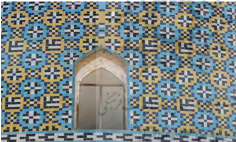
تصویر ۶: درهم تنیده شدن گلچین معقلی در قسمت نورگیر

این تکرار ادامه دارد تا به قسمت نورگیرها برسیم در قسمت نورگیرها این روند اجرا نشده است و ما دوردیف ستون معقلی زرد را کنار هم می بینیم؛ و این به این دلیل بوده که نام مبارک حضرت علی در این قسمت به صورت نا کامل بیان نگردد.