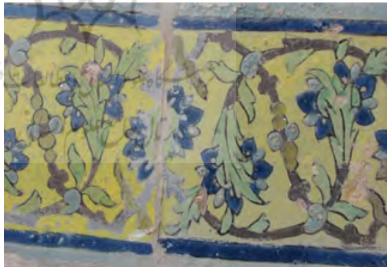
تصویر ۹: حاشیه‌های کناری ایوان مسجد

ختایی: ختایی ساقه گلی است که به صورت موزون سراسر طرح را می‌پیماید و به ابتکار هنرمند انواع گل، برگ غنچه تجریدی را بر آن می‌گستراند. (ریاضی، ۱۳۷۵: ۶۰).