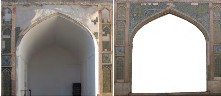
تصویر ۱۰: تصویر دو ایوان همجوار هم تخریب زیاد یکی از ایوان ها

نمود که شامل نقوش اسلیمی و ختایی به هم پیچان است. تزیینات ایوان شمال و جنوبی از لحاظ طرح و رنگ کاملاً شبیه هم و ایوان شرقی و غربی قرینه و همانند هم هستند. البته طرح در چهار ایوان یکسان فقط در دو ایوان قرینه جابجایی رنگ بین قاب بندی دوم و چهارم را داریم.