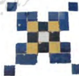
تصویر ۴: نقش مابین گلچین‌ها در فضای گریو گنبد

- خط بنایی یا خط معقلی ۵ : در دوره نادری نوعی نقش «گلچین معقلی» همراه با «خط معقلی منفرد» در گردونه این گنبد به چشم می‌خورد که می‌توان آن را از آثار این دوره یاد کرد. (زمرشیدی، ۱۳۹۳: ۲۱)