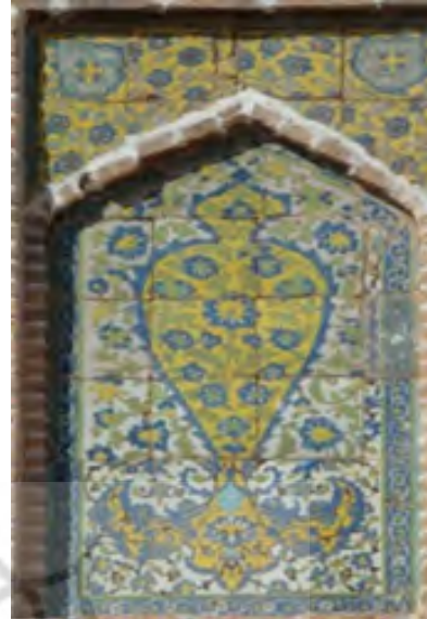
تصویر ۱۲: اولین تصویر کاشیکاری کناری ایوان از نمای بالا به پایین

پراکنده رویش داشته‌اند، نقوش اسلیمی و درهم پیچان ختایی؛ و اما نمونه‌ای از نقش گلدانی که در اینجا بکار رفته عنصری ضروری در همه تزیینات گلددار است، معمار ایرانی این عنصر را در انواع کاشیکاری و تزیینات بکار برده و از تنوع بسیاری برخوردار است.