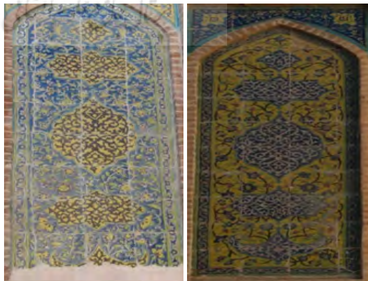
تصویر ۱۳: دومین نمای کاشیکاری از بالا به پایین

در ادامه طرح برای خطوط ساقه‌های ختایی قهوه‌ای و رنگ گل‌ها لاجورد، قرمز و... کار شده است این ستون در قسمت پایین با رنگ زمینه آبی تکرار گردیده است. منظور از جایجایی رنگ در این قاب بندی است که رنگ زرد و لاجورد در ترنج و زمینه با هم جایجا شده‌اند.