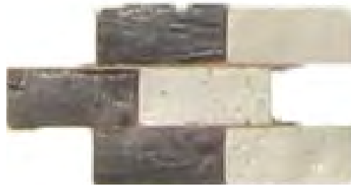
تصویر ۲: نواری از این گره در قسمت بالا و پایین گریو گنبد کار شده است.

- این نقش مایه آلاقرورد نام دارد که ظاهراً پس از اسلام به معماری راه یافته و به صورت حاشیه در بالای چندین مسجد از جمله مسجد کلات کار شده است و به صورت پیوسته در دورنگ مشکی و سفید، داخل نواری فیروزه‌ای و در قسمت پایین نقوش لوزی و نیم لوزی قسمت انتهایی طرح گلچین‌های معقلی تکرار شده است؛ و به عنوان نوار مرزی در قسمت بالایی و پایینی کتیبه خط ثلث بکار رفته است. مشابه این گره در بنای امام زاده محروق و مسجد گوهرشاد کار شده است.