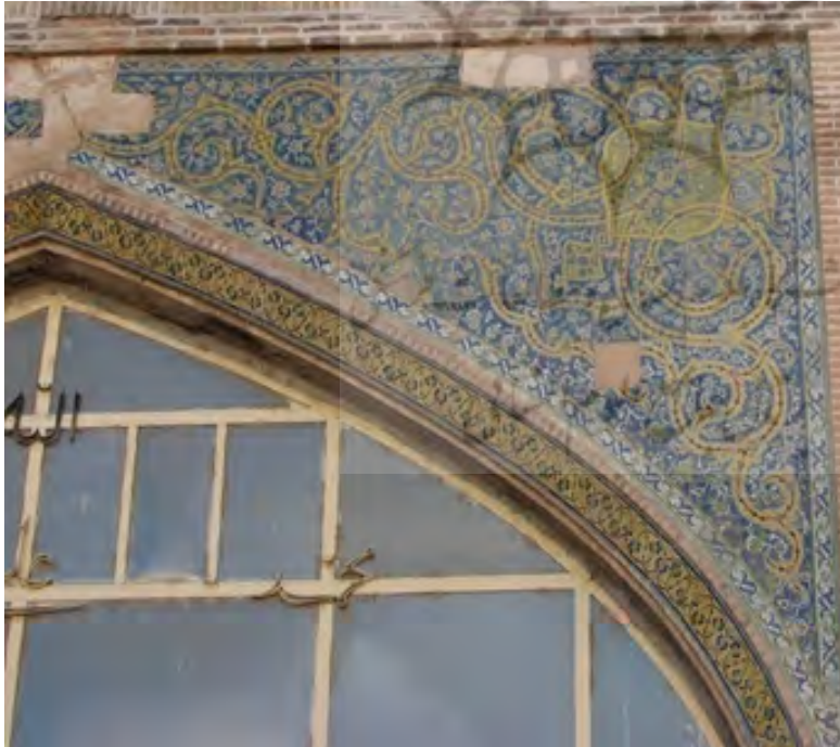
تصویر ۱۱: کاشیکاری لچکی ایوان شمالی مسجد

- در لچکی یکی از ایوان ها که سالم مانده و مقداری تخریب شده است (کاشیکاری این قسمت در بقیه ایوان ها کاملاً فرو ریخته است) شاهد نقوش اسلیمی به انواع دهن اژدری، اسلیمی برگدار به رنگ زرد و نقوش ختایی و تزیینی بسیار ریزتر که در زمینه لاجوردی کار شده است، هستیم. هنرمند با مهارت طراحی خود طرح اسلیمی را به رنگ زرد در ساقه های پیچان ختایی تنیده و با ترکیب این دو کاشیکاری را کامل نموده است.