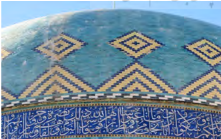
تصویر ۱: نقش بالای گنبد مرمت شده

- این نقش دورتادور قسمت بالایی گنبد به صورت پیوسته در قاب لوزی و نیم لوزی، در رنگ زرد برای زمینه و مشکی برای خطوط دورتادور و قابگیری طرح تکرار گردیده است. در این قسمت گنبد تنها این تزیین بکار رفته و قسمت بالایی همان سادگی را دارا می‌باشد. همین قسمت بخشی بوده که بیشترین صدمه را متحمل شده بود و ترمیم آن مربوط به سال‌های اخیر است.