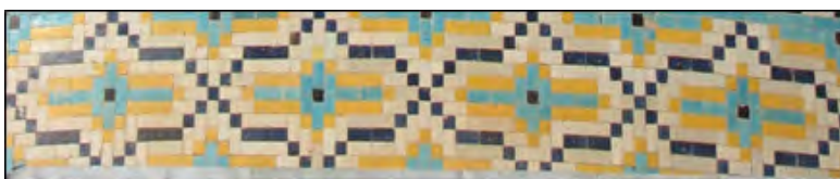
تصویر ۷: نقش هندسی قسمت انتهایی ساقه گنبد کلات

-این نقش هندسی که قسمت انتهایی گریوگنبد ۶ قرار دارد و جاهای خالی با قرینه اش پر شده است. در رنگ سفید برای زمینه و لاجورد، زرد، آبی فیروزه آبی برای خطوط دورتادور کار شده و قسمت انتهایی گریوگنبد و دورتادور آن را پوشانیده و زینت داده است.