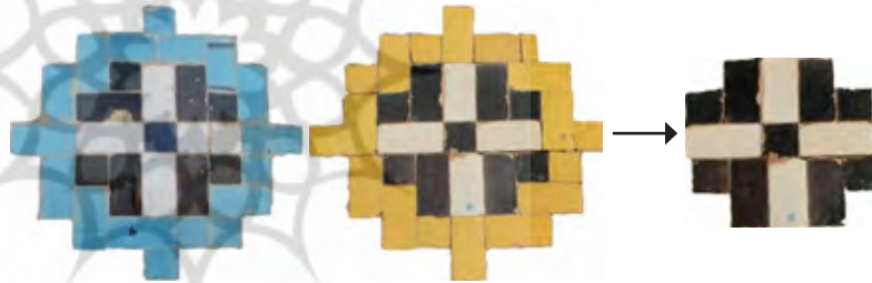
تصویر ۳: گلچین‌های معقلی

فضای اصلی گنبد که بخش اصلی تزیینات را کامل کرده نوعی گلچین معقلی ۴ است که این تزیینات را از آثار خوب دوره افشاریه بر شمرده‌اند. این گلچین معقلی در رنگ‌های قالب زرد و ابی و داخل نقوش رنگ سفید و سیاه کار شده است، با تکرار این گلچین‌ها فضای بصری گنبد مسجد پر شده، دو تزیین گلچین و هندسه آن شبیه هم فقط رنگ آن متفاوت می‌باشد؛ و نقش هندسی داخل هر دو گلچین معقلی یکسان است.