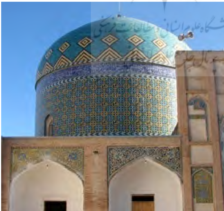
تصویر ۱۵: کتیبه خط ثلث مسجد

تزیینات در قسمت‌های دیگر صحن مسجد شاهد این نقوش بر رواق‌ها هستیم که در رنگ زمینه لاجورد و زرد تکرار شده است؛ و نقش در تمامی دیواره‌ها یکسان می‌باشد. در قسمت صحن کنار ایوان‌ها در رواق‌ها نقوش کاشیکاری‌ها را در رنگ زمینه لاجورد و زرد کنار هم مشاهده می‌کنیم.