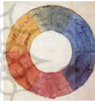
شکل ۱: چرخه رنگ گوته، (مأخذ گوته، سال ۱۸۱۰)

یک دایره رنگ ابتدایی که در آن رنگ‌های قرمز و زرد و آبی وجود دارند، در واقع دایره رنگ سنتی در هنرهای سنتی به شمار می‌آید. سرآیزاک نیوتن در سال ۱۳۶۶ اولین نمودار رنگ را به وجود آورد.