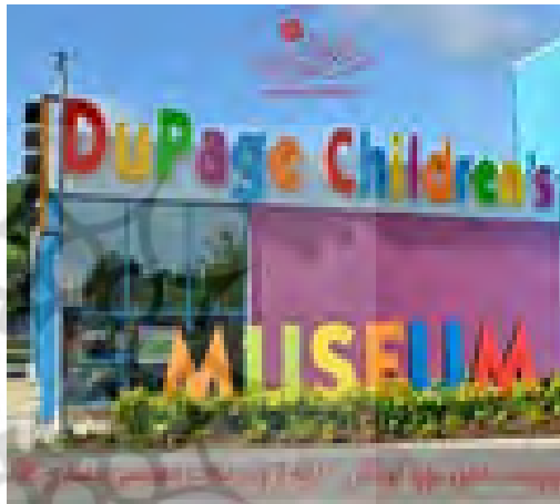
تصویر ۱- نمای بیرونی مهدکودک

کودکان Dupage که در سال ۱۹۸۷ به منظور آموزش خانواده‌ها و کودکان تأسیس شده. در رنگ آمیزی این موزه از ۲۰ رنگ مختلف استفاده شده است. این رنگ‌ها حس تحرک و پویایی جدیدی به ساختمان داده‌اند. کودکان در این موزه راهشان را به آسانی پیدا می‌کنند. همچنین دیدهای وسیع و فراگیری به قسمت‌های مختلف موزه وجود دارد که این امکان را برای والدین فراهم می‌آورد تا دورادور مراقب فرزندان خود باشند. در ورودی ساختمان کفپوش راه راهی وجود دارد که توجه کودکان را به فضاهای ویژه فعالیت و تفریح جلب می‌کند. هر، در فرمز رنگ، در ساختمان، دری برای خوشامدگویی است، دعوتی برای کشف و تجربه چیزهای جدید، اما پشت یک در آبی رنگ ممکن است فضای مخفی و پوشیده‌ای مثل یک انبار یا فضای مخصوص کارمندان وجود داشته باشد.