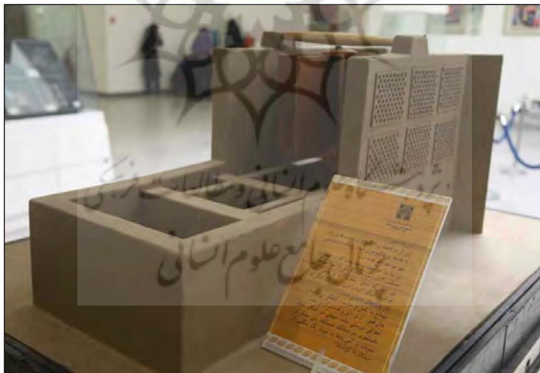
تصویر ۲: ماکت آسپاد قلعه مچی؛ موزه زاهدان