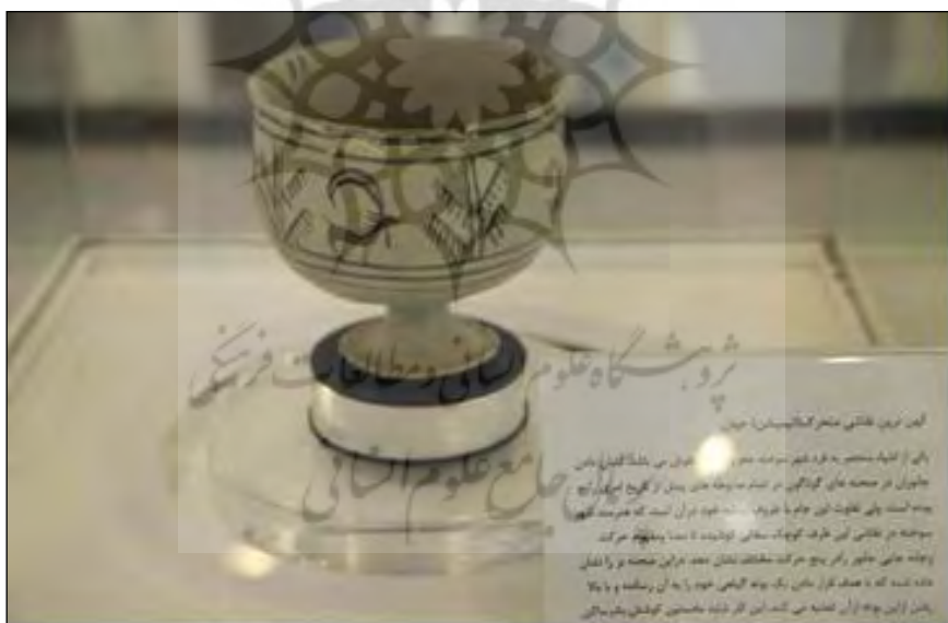
تصویر ۸: جام انیمیشن؛ موزه زاهدان