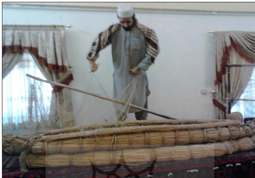
تصویر ۳: مرد سوار بر توتن یا قایق محلی؛ موزه زابل