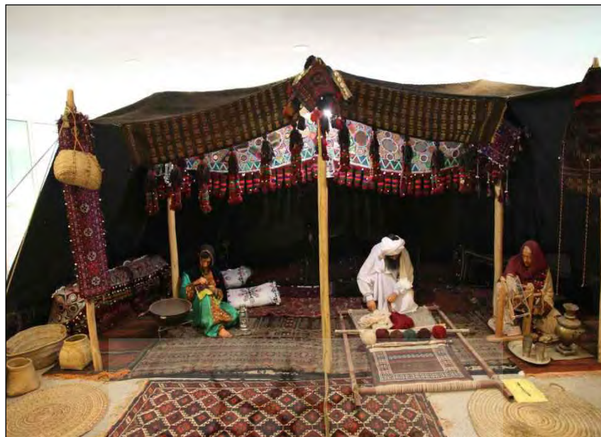
تصویر ۵: سیاه چادر بلوچ؛ موزه زاهدان