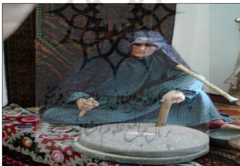
تصویر ۴: زن سیستانی در حال آسیاب کردن گندم؛ موزه زابل