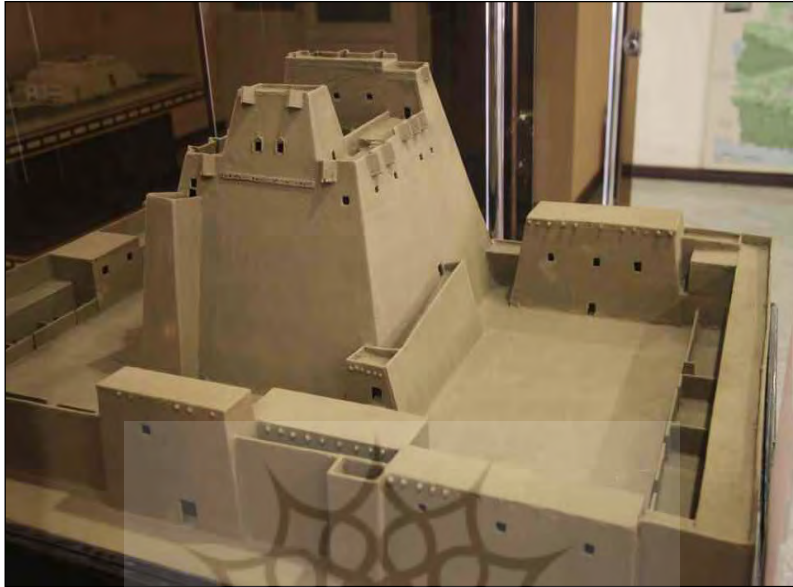
تصویر ۱: ماکت قلعه سب؛ موزه زاهدان