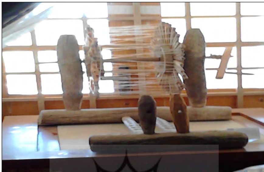
تصویر ۷: چرخ نخ‌ریسی؛ موزه زابل