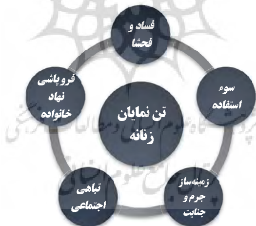
نمودار شماره ۲۰. مفصل‌بندی گفتمان مقاومت

همچنین فروپاشی نهاد خانواده را از پیامدهای جامعه‌ای می‌داند که در آن امر جنسی به واسطه حضور تن‌نمایان زنان به سرعت در حال انتشار است. «۲۰ هزار قربانی کوچولوی طلاق، چنان سخاوتمندانه اجازه می‌دهیم که فیلم‌های سینمایی و تلویزیونی و هنرنمایی‌های پاره‌ای از مطبوعات و کاباره‌ها و مانند آن‌ها همه سرمایه‌های ما را غارت کنند و جوانان و حتی بزرگسالان ما را به ابتذال بکشند، که هیچ آدم غافل و بی‌خبری چنین نمی‌کند...» (مکتب اسلام، ۱۳۵۲: شماره: ۳).