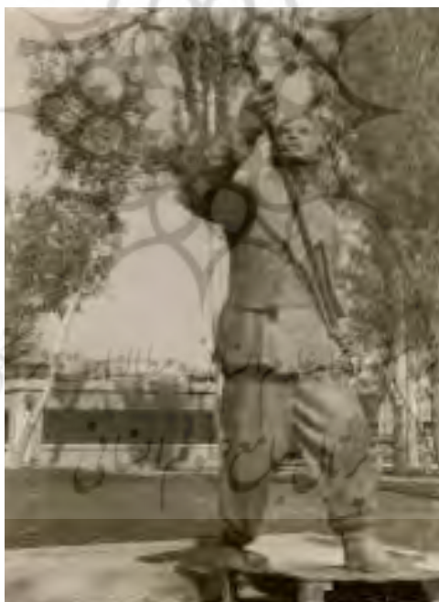
تصویر ۳: سرباز پرچمدار مجسمه نادرشاه (با یگانگی عکس انجمن آثار و مفاخر فرهنگی).

انجمن آثار ملی در پاسخ به نامه صدیقی، ضمن اشاره به پیشرفت کارهای ساختمانی آرامگاه نادرشاه و پیش‌بینی اتمام آن تا پایان سال ۱۳۳۷، از به تأخیر افتادن ساخت مجسمه نادرشاه و شرایط پیشنهادی قرارداد کارخانه برونی ایتالیا، ابراز تأسف شدید کرد (همان، سند شماره ۴۵۶). با وجود این، انجمن برای جلب رضایت ابوالحسن صدیقی به منظور تسریع در کار، پذیرفت علاوه بر مبلغ یک میلیون ریالی که قبلاً متعهد به پرداخت به وی شده بود، مبلغ یکصد و بیست هزار ریال دیگر هم در مقابل ساخت ماکت گچی مجسمه، اقامت در ایتالیا و نظارت بر مراحل ساخت و نصب مجسمه اصلی به او بپردازد. اما افزایش مبلغ قرارداد کارخانه برونی را غیرمنطقی و غیرعملی دانست و تهدید کرد در صورت اصرار کارخانه بر مبلغ پیشنهادی خود و روشن نبودن تعهدات آن، کار را به کارخانه دیگری واگذار خواهد کرد (همان، اسناد ساماندهی نشده/۱۰-۱۳۹۸).