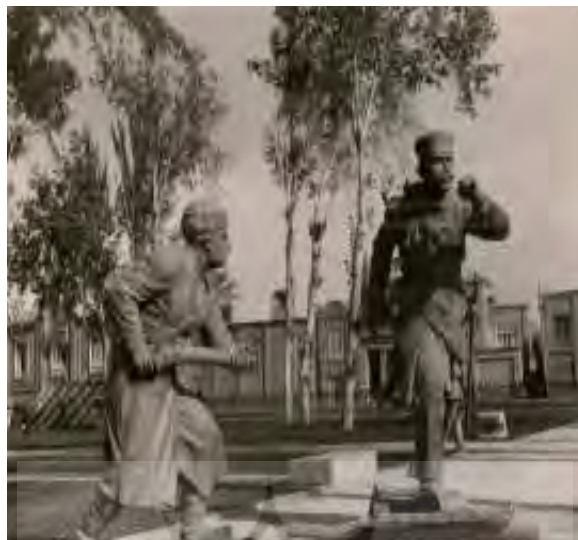
تصویر ۴: سربازان شیپورزن و تفنگدار مجسمه نادرشاه.