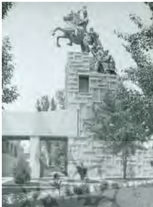
تصویر ۵: کرپ مجسمه نادرشاه.