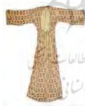
تصویر ۳. پیراهن رو یا انتاری

پالتو (فراج) (Ferace): روپوش تیره و گشاد پشیمی که گاهی با خز آراسته می‌شد و هنگام هوای سرد بیرون از خانه پوشیده می‌شد (تصویر ۲). جلیقه (یلک) (Yelek): کت بلند و اندکی تنگ با آستین‌هایی تا آرنج یا تا مچ از جنس ابریشم با حاشیه کتان که هنگام خروج از منزل در هوای سرد پوشیده می‌شد. پیراهن رو (انتاری) (Entari): کت یا پیراهن با وزن متوسط شبیه A که در قسمت کمر تنگ و از پهلو سه‌تکه در قسمت جلو روی هم قرار می‌گیرد و معمولاً تا روی زمین می‌رسید. گردن معمولاً گرد یا V شکل بود و از قسمت جلو با دکمه‌های کوچک یا گره یا قلاب بلند بسته می‌شد، هرچند معمولاً در قسمت جلو از گردن تا قفسه سینه بدون دکمه ترسیم می‌شود و از قسمت کمر تا روی زمین هم همین‌طور. آستین‌ها معمولاً تا آرنج گشاد است، اگرچه گاهی هم، تحت‌تأثیر ایرانیان و ایتالیایی‌ها، تا مچ‌ها تنگ می‌شود. بعضی اوقات سر آستین‌ها به‌شدت بلند و گشاد می‌شد و مانند لباس ایرانیان یک شکاف داشت. جنس آن اغلب از ابریشم با حاشیه کتان بود. معمولاً دارای تزئینات بود، اما لبه داخلی با ابریشم آستردوزی می‌شد (تصویر ۳).