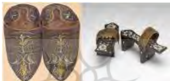
تصویر ۷. کفش و نالین

کفش: پاپوش هایی که مانند جوراب درست می شد و از چرم نرم زرد رنگ یا گل دوزی شده و زربفت بود که در داخل پوشیده می شد و چکمه های نرم که خارج از منزل و نالین (Nalin) و کابکابس (Kabkabs) برای حمام رفتن استفاده می شد (تصویر ۷).