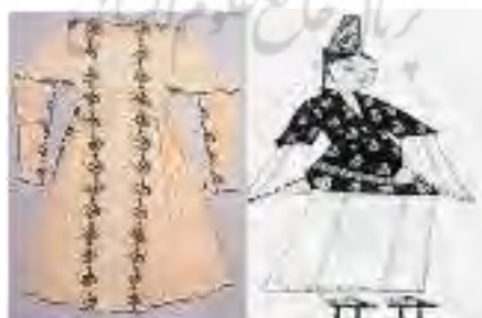
تصویر ۶. گوملک یا همان پیراهن ایرانیان (Khazarina, 2008: 10).

گوملک (Gumlek) یا گوملوک: زیرپیراهنی سبک‌وزن و یک‌راست با آستین‌های اغلب تنگ و بلند و یقه‌گرد که از جنس کتان سفید، ابریشم یا لینن دیده می‌شد. بعضی از نقاشی‌ها گل‌دوزی و بافت‌هایی را در قسمت درزها و لبه‌ها و حاشیه‌ها نشان می‌دهد [معادل «پیراهن» در ایران است] (تصویر ۶).