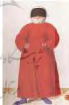
تصویر ۲. فراج یا پالتو از مقاله لباس زنان ترک (Khazarin, 2008: 5)

هیرکا (Hirka) یا چیرکا: ژاکت یا جلیقه بسیار تنگ که روی «گوملک» پوشیده می‌شد. ممکن بود با آستین و سرآستین‌های گشاد تا آرنج باشد یا بلندتر و آستین تنگ تا مچ (تصویر ۴).