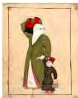
تصویر ۹. زن روستایی عثمانی قبل از سال ۱۶۵۷

در لباس‌ها از طلا و نقره، ساتن، پارچه ابریشمی گل برجسته، و انواع زیادی از ابریشم استفاده می‌شود. این پارچه‌ها توسط افراد ثروتمند و اشراف شهر انتخاب می‌شوند، اما روستاییان و افراد فقیر لباس‌های مناسبی ندارند. لباس‌ها بدون چین روی زمین می‌افتند، ترک‌ها سر خود را با روسری تا اطراف ابرو می‌پوشانند (Orli, 2006). (تصویر ۹).