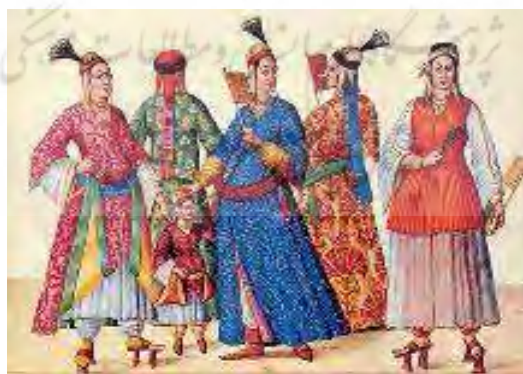
تصویر ۸ کلاه فز

پوشش سر «فز» (Fez): نقاشی های قرن شانزدهم زنان را با این کلاه نشان می دهد که روی یک روسری رنگی و زیبا قرار دارد که از پشت سر آویزان است و با پیشانی بند بسته شده است (Okumura, 2013) (تصویر ۸).