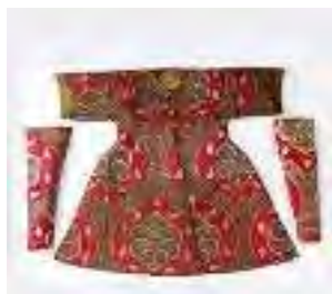
تصویر ۴. هیرکا یا جبه

کوشاک (Kusak): کمر بند یا شال کمر نرم و وسیع که از روی انتاری بسته می‌شد. اوچکار (Ockar): کمر بند چرم یا فلزی که با طلا یا عاج یا پلاک‌های نقره، سنگ‌های نیمه‌قیمتی، منجوق، و مهره تزئین می‌شد (تصویر ۵).