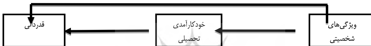
شکل ۱. مدل مفهومی پژوهش حاضر

نظر به روزآمد بودن حوزه‌ی روان‌شناسی مثبت به طور عام و حوزه‌ی تحقیقاتی قدردانی به صورت خاص، این پژوهش همگام با پژوهش‌های جدید مطرح در روان‌شناسی می‌باشد. قدردانی، شرط با هم بودن در جوامع پیشرفته‌ی امروزی است. امروزه قدردانی صرفاً نه به عنوان یک سازه‌ی اخلاقی، بلکه به عنوان یکی از ویژگی‌های شخصیت سالم و حتی به عنوان یکی از عناصر روان‌شناسی مثبت مورد توجه قرار گرفته است. در حالی که در ایران، مطالعات اندکی به بررسی این سازه در ارتباط با مجموع متغیرهای روان‌شناختی پرداخته شده است. علاوه بر این، بررسی‌های محقق در داخل کشور حکایت از این دارد که شناسایی عوامل مؤثر بر قدردانی، تاکنون در گروه سنی نوجوان بررسی نشده است. از اینرو، این خلأ احساس می‌شود که این سازه در گروه سنی نوجوان مطرح گردد. با وجود آن که اخیراً پژوهش‌هایی در زمینه‌ی حوزه‌های روان‌شناسی مثبت در مدرسه و دانشگاه صورت گرفته است، اما کمتر پژوهشی به بررسی عوامل توانمندساز حوزه‌ی قدردانی و همچنین تبیین نقش متغیرهای میانجی در قالب یک مدل علی پرداخته‌اند (ریکارت و همکاران، ۲۰۱۷، ژانگ و همکاران، ۲۰۱۷). بنابراین پژوهش حاضر سعی در یافتن متغیرهای تأثیرگذار جهت ارتقای قدردانی دانش‌آموزان و همچنین عملیاتی کردن مدل مفهومی قدردانی دارد. بنابراین هدف اصلی پژوهش حاضر تبیین قدردانی بر اساس ویژگی‌های شخصیتی با واسطه‌گری خودکارآمدی تحصیلی بود (شکل ۱).