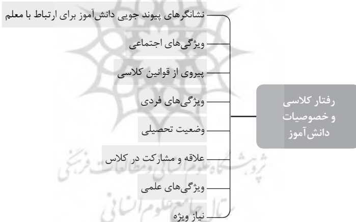
نمودار ۲. رفتارهای کلاسی و خصوصیات مؤثر بر ارتباط دانش‌آموز از دیدگاه معلم

در نمودار ۲، رفتار کلاسی و خصوصیات دانش‌آموز که از دیدگاه معلم باعث تسهیل و ارتقای کیفیت ارتباط معلم - دانش‌آموز مشاهده می‌شود، به ترتیب نزولی اهمیت و پرتکراری آورده شده است.