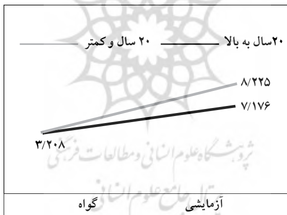
نمودار ۲ تعامل بین روش تدریس و سابقه تدریس معلمان

سؤال ۳. آیا روش تدریس ساختن‌گرایی و مدرک تحصیلی معلمان بر عملکرد دانش‌آموزان تأثیر دارد؟ از آزمون تحلیل واریانس دو عاملی به‌منظور بررسی میزان تأثیر تدریس با روش ساختن‌گرایی و مدرک تحصیلی معلمان بر عملکرد دانش‌آموزان در آزمون استفاده شده است. با توجه به یافته‌های جدول شماره ۶، تفاوت دو گروه آزمایش و کنترل ( F_{(1,227)} = 97/093, P \geq 0/01 ) معنادار است. اما تفاوت عملکرد گروه‌های معلمان با مدارک تحصیلی متفاوت ( F_{(2,227)} = 1/258, P \geq 0/05 ) و عامل اثر متقابل ( F_{(2,227)} = 1/434, P \geq 0/01 ) معنادار نیست.