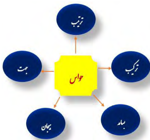
شکل ۴. عناصر مهم حواس در برقراری ارتباط مؤثر

همان‌گونه که شکل ۴ نشان می‌دهد با توجه به مفهوم زبامغز، ترکیب حواس با یکدیگر و چگونگی ترتیب آن‌ها (حس‌آمیازی) ۱ ، جهت و میزان استفاده از حواس در کلام و ارتباط آن‌ها با هیجان نقش مهمی در برقراری ارتباط دارد و گوینده باید به این مؤلفه‌ها برای تنظیم کلام خود و استفاده از واژگان زبانی توجه ویژه مبذول دارد.