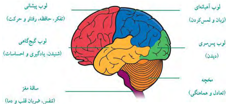
شکل ۲. لوب‌های مغز و کارکردها ۱

همان‌گونه که در شکل ۲ مشاهده می‌شود، قسمت جلوی مغز (پیشانی)، مربوط به تفکر، حافظه، رفتار (تصمیم‌گیری) و حرکت است و تجزیه و تحلیل در آن اتفاق می‌افتد. قسمت مرکزی سر مربوط به زبان، لمس کردن و انجام دادن است. بخش دیداری انسان (رصد کردن و دیدن تجربیات گذشته) مربوط به قسمت پشت مغز است و قسمت کناری سر که نزدیک گوش‌هاست، بخش مربوط به شنیداری، یادگیری و احساسات (دریافت کردن) است (اوروال، ۲۰۰۹) بنابراین، هنگامی که فرد کلمه‌ای را در متنی می‌بیند، آن کلمه نخست به بخش دیداری (قسمت پشت مغز) می‌رود و در زیر این قسمت بخش هیجانات قرار گرفته است. در آنجا مغز جستجو می‌کند که آیا آن کلمه را پیش از این دیده یا ندیده است و آن کلمه دارای چه معنایی است. سپس، کلمه مورد نظر برای تجزیه و تحلیل به قسمت پیشانی مغز می‌رود و آن کلمه و معنایش در بافت بررسی می‌شود. در پایان به بخش فوقانی مغز برای انجام دادن (به‌عنوان مثال نوشتن) می‌رود.