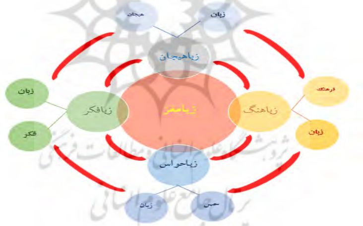
شکل ۳. الگوی زبامغز و زیرمجموعه‌های آن

الگویی به نام زبامغز را مطرح نموده است. وی معتقد است «در زبان‌شناسی اصولاً زبان را از مناظر مختلف که عموماً از جزء به کل است (واج‌شناسی ۱ ، ساخت‌واژه ۲ ، نحو ۳ ، معناشناسی ۴ ، کاربردشناسی ۵ ، تحلیل گفتمان ۶ و غیره) بررسی می‌کنند»، اما الگوی زبامغز اشاره به نمود زبان در مغز دارد و اینکه زبان در مغز چگونه تجلی پیدا می‌کند. به عبارت دیگر، افراد در صحبت کردن خود می‌توانند از کل کارکردهای مغز و ساختار مربوط به آن استفاده کنند تا بتوانند ارتباط خوبی را با مخاطب برقرار کنند. بنابراین، در این الگو با توجه به اهمیت دادن به مباحثی مانند زبان و تفکر، زبان و هیجان، زبان و حواس، زبان و فرهنگ و جایگاه هر یک از آنان در ساختار مغز مفاهیمی مانند زبافکر (نمود فکر در زبان)، زباهیجان (نمود هیجان در زبان)، زباحواس (نمود حواس در زبان) و زباهنگ (نمود فرهنگ در زبان) مطرح می‌شوند که در شکل ۳ قابل مشاهده هستند: