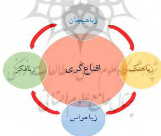
شکل ۵. مؤلفه‌های مؤثر در اقناع‌گری

از این رو، در مکالمات بهتر است هیجان‌سنجی زبانی صورت گیرد و گوینده باید نشانه‌های هیجانی را رصد کند تا بداند آیا مکالمه را باید ادامه بدهد یا خیر؟ در واقع، با معرفی الگوی زبامغز از هیجانات در زبان (زبایه‌جان)، تفکر پشت عبارات زبانی، توجه به ترتیب و ترکیب حواس و در نظر گرفتن فرهنگ بومی می‌توان برای اقناع‌گری و رسیدن به خواسته‌ها استفاده کرد: