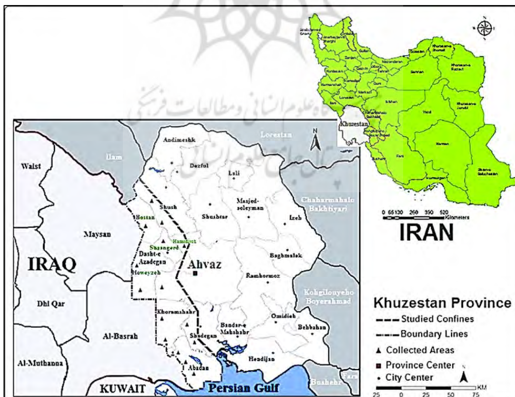
نقشه ۲: موقعیت شهر اهواز در استان خوزستان

رودهای خوزستان عبارتند از: کارون - کرخه - دز - مارون و هندیجان زهره. میانگین بارندگی در استان خوزستان طی سالهای ۱۳۳۰ تا ۱۳۶۵ در اهواز ۱۹۹ میلیمتر بوده است. اکثر مردم فارسی و عشایر مقیم و بومی خوزستان به عربی و بختیاری، لری و لهجه دزفولی، شوشتری و ترکی صحبت می‌کنند. از نظر تقسیمات کشوری و جغرافیایی این استان شامل ۱۶ شهرستان ۲۸ شهر ۲۶ بخش و ۱۱۱ دهستان می‌باشد. شهرهای خوزستان عبارتند از: اهواز مرکز استان - آبادان - ایذه - بندر ماهشهر - بهبهان - خرمشهر - دزفول - سوسنگرد - رامهرمز شوشتر - مسجد سلیمان - اندیمشک - باغمک - شادگان - شوش - امیدیه. حضور فعال ۸ هزار ساله دولتهای باستانی ایلام هخامنشیان، اشکانیان، ساسانیان و اعراب و مسلمانان سیراقوام را می‌توان از آثار و یادمانهای باستانی بجای مانده در شهرهای ایذه - مسجد سلیمان - شوش و شوشتر - هفت تپه بهبهان اهواز دریافت. چغازنبیل در نزدیکی هفت تپه و کاخ اپادانا در شوش و کول فره در ایذه از دبدنی ترین آثار باستانی و مقبره دانیال نبی در شوش از زیارتگاههای مهم به شمار می‌آید در خصوص وجه تسمیه اهواز گفته‌اند، اهواز جمع عربی کلمه مفرد هوز = حوز است که ابتدا به یک قبیله از آن اطلاق می‌شده و ایرانیان آن را به عنوان ایالتی برای تعیین ناحیه قدیم ایلام به کار بردند که به آن کرسی ایالت خوزستان نیز گفته می‌شده است. نام قدیم آن هرمز دار در شیر و پس از آن سوق الاهواز و در عهد قاجاریه آن را ناصری یا ناصریه نامیده‌اند در سال ۱۳۱۴ هجری شمسی اهواز نامیده شد اردشیر سد بزرگی بر کارون نهاد در عصر وی وجانشینانش، این شهر رونق و اعتبار فراوان داشت و به جای شوش پایتخت سوزیانا یا خوزستان گردید (Hosseini Kohnouj et. al. 2015).