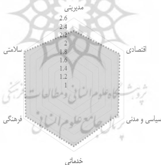
شکل شماره ۲. وضعیت ابعاد حق به شهر در محدوده مورد مطالعه

شکل شماره (۲) مقایسه‌ای از مقادیر میانگین ارزش‌گذاری شده ابعاد حق به شهر می‌باشد که این نمودار حاکی از وجود تفاوت‌های نسبی در میان ابعاد تحقیق می‌باشد. اگرچه مقادیر میانگین ابعاد به‌طور کلی دارای وضعیت نسبت پایینی هستند با این‌وجود بعد سلامتی با میانگین ۲/۵۷ و بعد فرهنگی با میانگین ۲/۵۳ بیشترین میانگین‌ها را به خود اختصاص داده‌اند و از طرف دیگر نیز بعد مدیریتی با میانگین ۲/۲۸ و بعد سیاسی و مدنی با میانگین ۲/۴۲ کمترین میانگین‌ها را دارا بوده‌اند.