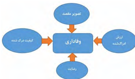
شکل شماره ۱. مدل مفهومی پژوهش

بی تفاوت باشند، درواقع با توجه به ویژگی‌ها، قیمت و، تسهیلات مرتبط با محصول و نیز تقریباً بدون توجه به نام و نشان تجاری آن، خرید می‌کنند. در این حالت، احتمالاً ارزش ویژه برند بسیار کم است. ولی اگر مشتریان، حتی در صورتی که رقبا، ویژگی‌های بهتر، قیمت و یا تسهیلات مناسب‌تر نیز ارائه می‌کنند، به خرید از برند خاصی ادامه دهند، این منجر به افزایش قابل توجه آن برند خواهد شد، بنابراین می‌توان وفاداری به برند را به‌عنوان تعهدی برای خرید مجدد تعریف نمود (Gil,2007:189).