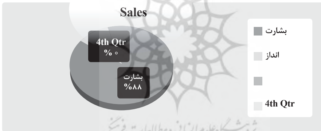
نمودار شماره ۲. سنجش فراوانی تقدم بشارت بر انذار در قرآن کریم

در آیات ۱۱۹ و ۲۱۳ بقره، ۱۶۵ نساء، ۱۸۸ اعراف، ۴۸ انعام، ۲ هود، ۱۰۵ اسراء، ۹۷ مریم، ۵۶ کهف، ۲۸ سبأ، ۲۴ فاطر، ۴ فصلت، ۵۶ فرقان، ۴۵ احزاب، ۸ فتح و در آیه ۱۹ سوره مائده دو بار این دو واژه یا مشتقاتی از آن کنار یکدیگر آمده است. این آیات پیامبران و کتب آسمانی و به طور خاص پیامبر اسلام (ص) و قرآن را مبشر و منذر معرفی می‌نماید که با توجه به سیاق آیات هر یک پیامی را در بر دارد که با مراجعه به جامع التفاسیر استخراج شده و در جدول فوق بدان اشاره شده است. نکته جالب آنکه در این ۱۷ مورد، تنها در آیه ۱۸۸ سوره اعراف و آیه ۲ سوره هود اول انذار و سپس بحث بشارت مطرح شده است که آن هم از قول پیامبر (ص) است. در ۱۵ مورد دیگر که همگی از قول خداوند نقل شده بشارت دادن مقدم بر انذار آمده است. سنجش فراوانی این آمار به شکل زیر می‌باشد.