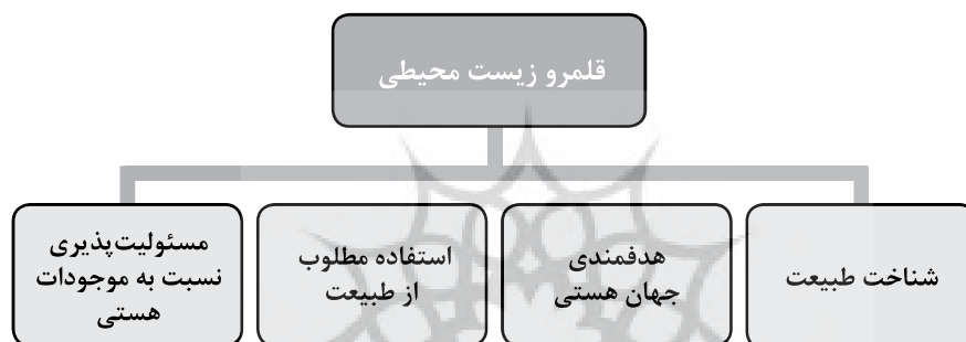
شکل ۵. عناصر قلمرو زیست محیطی سبک زندگی

روی موازین عقل و دین باشد، رابطه صحیح بوده و ثمره خواهد داشت، در غیر این صورت، نتیجه منفی و بدبختی را به همراه خواهد داشت (موسوی لاری، ۱۳۸۶: ۵۷). قلمرو زیست محیطی ابعاد گوناگونی دارد. بر اساس شواهد حدیثی از امام رضا (ع)، عناصر چهارگانه قلمرو زیست محیطی عبارتند از: شناخت طبیعت، هدفمندی جهان هستی، استفاده مطلوب از طبیعت و مسئولیت‌پذیری نسبت به موجودات هستی است که در شکل ۵ آمده است.