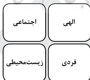
شکل ۱. قلمروهای سبک زندگی در آموزه‌های تربیتی امام رضا (ع)

که مستحق آن است، برساند. شناخت نسبت به خود، داشتن یک نگرش واقع‌بینانه از ضعف‌ها و توانایی‌های خود، تکیه کردن بر توانایی‌ها و استعدادها و خود و توفیق بیشتر در تعامل بهینه با دیگران، خداوند و طبیعت می‌تواند تعیین کننده سبک زندگی فرد در ارتباط با خود باشد. همچنین وقتی فردی با خداوند ارتباط برقرار می‌کند و این ارتباط نه اتفاقی، فصلی، بلکه در متن زندگی است که به شکل مستمر، دائمی و برای هر لحظه تعریف شده است، این فرد از این رابطه وابسته و دل‌بسته به خداوند می‌شود و سعی می‌کند برای تعمیق ارتباط خود دستورات الهی را انجام و از منهای الهی پرهیز کند. امری را درست بداند و انجام دهد که خداوند فرموده است و این به معنای انتخاب سبک خاصی از زندگی در ارتباط با خدا است. همین‌طور برقراری ارتباط‌های دیگری که فرد با دیگران و طبیعت بر مبنای دستورات الهی دارد، می‌تواند به عنوان سبک‌های زندگی در ارتباط با جامعه و طبیعت باشد. سبک زندگی‌ای که جامع این ارتباط‌ها باشد، منجر به فلاح و رستگاری همیشگی فرد و جامعه می‌شود. این قلمروها ریشه فطری دارند و اقتضای فطرت آدمی هم از مجموعه گرایش‌ها، امیال، ادراکات و توانمندی‌ها و تعاملات قلمروهای مذکور است و از آن جا که خدای حکیم این اقتضائات را در راستای اهداف تکاملی در انسان سرشته است، توجه بهینه به این قلمروها می‌تواند او را به اهداف والا هدایت نماید. سبک زندگی صحیح بدون شکوفایی این قلمروها در انسان امکان‌پذیر نیست. در حقیقت پرورش این قلمروهای چهارگانه است که آدمی را به سبک زندگی انسانی هدایت می‌کند و رشد و بالندگی سعادتمندانه را در زندگی موجب می‌گردد و هدف قرب و کمال مطلوب را برای خود فراهم می‌سازد.