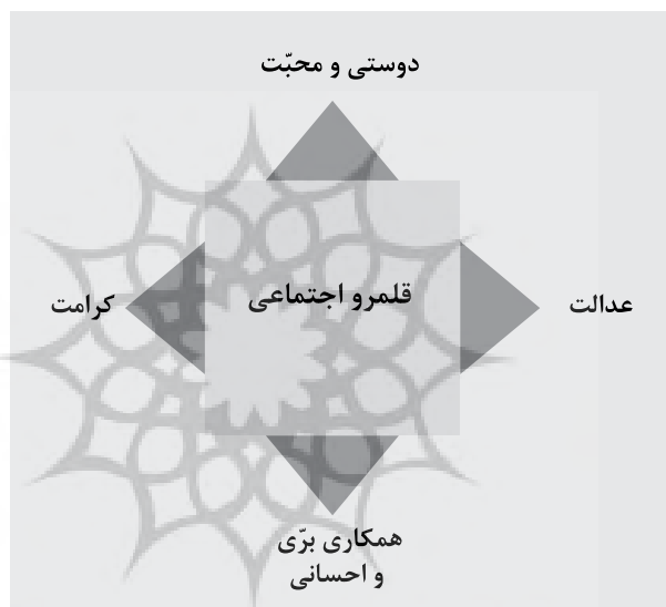
شکل ۴. عناصر قلمرو اجتماعی سبک زندگی در آموزه‌های تربیتی امام‌رضا (ع)

۲۸؛ تغابن، ۱۵؛ اعرافی، بهشتی، فقیهی و ابوجعفری، ۱۳۸۶: ۱۸۵-۱۸۴؛ قطبی، ۱۳۸۹: ۸۴-۸۶)، مسلمان با مسلمان(حجرات، ۱۰؛ اعرافی و همکاران، ۱۳۸۶: ۱۸۸؛ مجلسی، ۱۴۰۳ ق، ج ۷۱: ۳۱۶) و مسلمان با غیرمسلمان(اعرافی و همکاران، ۱۳۸۶: ۱۹۰)، می‌شود. دوستی و محبت، عدالت، همکاری بزی و احسانی و کرامت چهار عنصر اساسی است که در آموزه‌های تربیتی امام‌رضا(ع) بر آن تأکید شده است. عناصر مذکور در شکل ۴ قابل ملاحظه است.