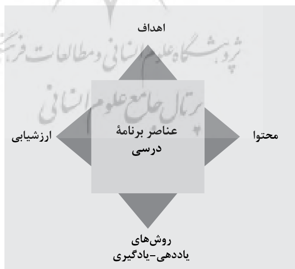
شکل ۶. عناصر برنامه درسی

کاربرد مسائل مختلف در برنامه درسی مستلزم بهره‌گیری از یک چارچوب نظری یا نظریه زیربنایی و مبتنی بر اصول و موازین علمی و نیازهای واقعی است تا بتواند به‌عنوان راهنمای عمل در بررسی و اجرای مراحل پژوهش مورد استفاده قرار گیرد. در این راستا راهکارهای اشاعه سبک زندگی امام‌رضا(ع) در برنامه‌های درسی نظام تعلیم و تربیت رسمی و عمومی ایران می‌تواند در چهار عنصر اهداف، محتوا، روش‌های یاددهی-یادگیری و ارزشیابی تجلی یابد (شکل ۶). به عبارت دیگر، موارد چهارگانه مذکور، عناصری هستند که نمایانگر وجوه مختلف برنامه‌های درسی‌اند و هرکدام می‌توانند به نحوی، در بسط سبک زندگی مورد نظر امام‌رضا(ع)، سهمیم باشند.