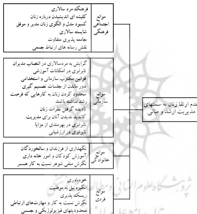
شکل ۱ مدل شماتیک موانع ارتقا زنان به سمت‌های مدیریتی میانی و ارشد

ویژه در دوره‌هایی خاص از چرخه‌ی زندگی کاری می‌شود (سیدان و خلیفه‌لو، ۱۳۸۷). هم‌چنین، مسئولیت‌های خانوادگی، مادری و همسری موجب بروز نگرش منفی نسبت به توانایی زنان می‌شود. این مسأله که از زن انتظار می‌رود، تمایلات و تعهدات کاری را طوری تنظیم و تعدیل کند که با کاستن از تقاضاهای کاری بتواند تقاضاهای خانواده را برآورده سازد، در نگرش مدیران تأثیر منفی داشته است (زمانی، ۱۳۸۸). مجموعه قوانین و مقررات مکتوب سازمانی، عدم برابری در فرصت‌های رشد، آموزش و نابرابری در ارزیابی‌ها و پرداخت‌های مالی و استفاده از مزایا، فرهنگ مردسالارانه محیط کاری و نادیده نگاشتن زنان در سازمانها نیز عواملی است که تحت موانع سازمانی، زنان را از تصدی سمت‌های مدیریتی بازمی‌دارد (کوپر جکسون ۲۷ ، ۲۰۰۱).