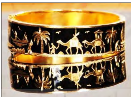
تصویر ۱۷. دستبند طلایی سیاه‌قلم شده، زیورآلات اقوام صابئین مندایی اهواز

زیباتر شدن کار، نقوش با قلم‌های مخصوص حکاکی می‌شود و در نهایت با پرداخت اثر محصول نهایی به دست می‌آید (اصغرزاده، زاهدپور، ۱۳۹۴، ۴-۵) در تصویر (۱۷) به نمونه‌ای از آثار معاصر هنرمندان صبی اشاره شده است.