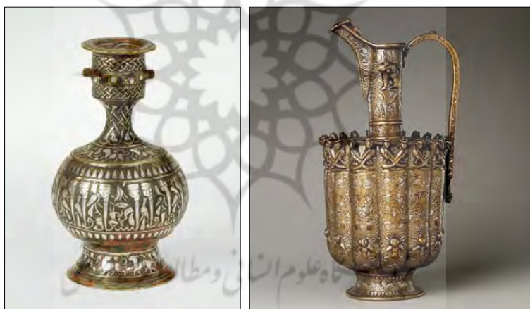
تصویر ۱۴. ابریق برنزی نقره‌کوب و سیاه‌قلم، قرن ۱۲ میلادی، ایران، خراسان، موزه

نوع تضاد در رنگ‌ها و ایجاد سایه‌روشن است که صنعت‌گران و هنرمندان فلزکار آن را به بهترین نحو بر روی اشیاء فلزی ایجاد می‌کردند» (افروغ، ۱۳۹۵، ۵۴). بنا بر این سیاه‌قلم هم شیوه‌ای از ترصیع می‌باشد. در آثار ترصیع‌شده سلجوقی عموماً کاربرد هم‌زمان شیوه طلاکوبی و نقره‌کوبی به شکل مفتولی یا ورقه‌ای و نیز کاربرد ماده سیاه‌قلم قابل مشاهده است. شایان ذکر است که طلاکوبی یا نقره‌کوبی ورقه‌ای با چکش‌کاری صورت می‌گرفته است و ورقه‌های طلا و نقره با حرارت بر روی سطح فلز پایه تثبیت نمی‌شده است بنا بر این امکان‌کننده شدن و ریختن فلزات طلا و نقره از سطح فلز پایه امکان‌پذیر بوده است. به نظر می‌رسد ماده سیاه‌قلم در کنار کارکرد تزئینی، خاصیتی لحیم‌کننده و تثبیت‌گر برای ورقه‌های طلا و نقره (بر روی فلز پایه) داشته است و ویژگی بارز هنر فلزکاری دوره سلجوقی کاربرد هنر فلزکوبی در کنار هنر سیاه‌قلم است. در تصویر (۱۴) به نمونه‌ای از ابریق برنزی متعلق به دوره سلجوقی اشاره شده است که دارای تزیینات نقره‌کوبی و سیاه‌قلم است.