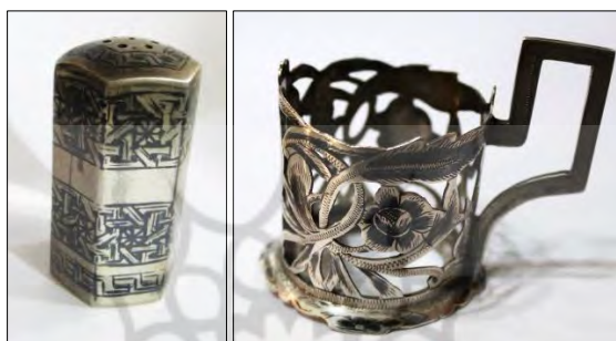
تصویر ۱۸. زیراستکانی نقره‌ای، اثر هنرمندان ارمنی تبریز تصویر ۱۹. نمکدان نقره‌ای، اثر هنرمندان ارمنی تبریز