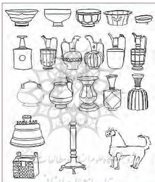
تصویر ۱. گونه‌شناسی برخی آثار فلزی در عصر سلجوقی (رازانی، بخشده‌فرد، توکلی، ۱۳۸۹، ۵۹)

باید خاطر نشان کرد که ظروف و آثار فلزی دوره سلجوقی به لحاظ فرمی و ساختاری پیرو دوره‌های پیش از خود می‌باشند اما تنوع در شیوه تزیین آثار مشاهده می‌شود. در تصویر (۱) به انواع فرمی و ساختاری برخی ظروف و آثار دوره سلجوقی اشاره شده است: