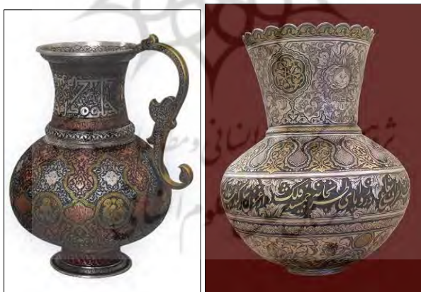
تصویر ۲۰. گلدان نقره، اثر محمدمهدی باباخانی، موزه حسن پور اراک، ( https://fa.wikipedia.org )