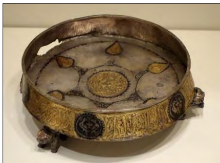
تصویر ۱۶. ظرف نقره‌ای زراندود، حکاکی شده و مزین به سیاه‌قلم، دوره سلجوقی، اواخر قرن ۱۲ و اوایل قرن ۱۳ میلادی، Cincinnati Art Museum. ( https://commons.wikimedia.org )

اهمیت فلزکاری سلجوقی در ارائه هنر ترصیع در کیفیت و تنوع رنگی بالا است و ویژگی بارزی که سبب تمایز فلزکاری این دوره با دوره‌های قبل‌تر است کاربست نقره‌کوبی، طلاکوبی و سیاه‌قلم بر روی پایه مسی و برنزی است. در واقع در هنر فلزکاری این دوره بیشترین تنوع و طیف رنگی در تزئین فلزات به کار می‌رفته است و همین سبب شده است با ممنوعیت استعمال طلا و نقره در ساخت ظروف هم‌چنان تفاخر و کیفیت هنری در تولید آثار حفظ شود.