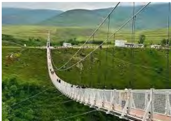
پل معلق مشگین شهر بزرگترین پل معلق خاورمیانه

نورپردازی‌های مناسب قرار است در آینده نه چندان دور در شهر ما افتتاح گردد. (شهر بازی آبی) که انتظار می‌زود این پدیده با توجه خاص و استقبال بیشتر گردشگران روبرو شود و اقتصاد این شهر را دگرگون سازد و چرخه اقتصادی به گل نشسته این شهر را در گذشته به چرخه اقتصادی پویا، هدفمند و فعال تبدیل کند و چهره شهر به کلی دگرگون شود.