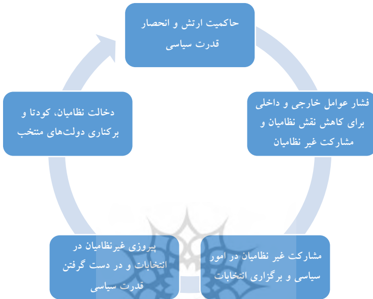
شکل ۱. چرخه تحول در سیاست داخلی