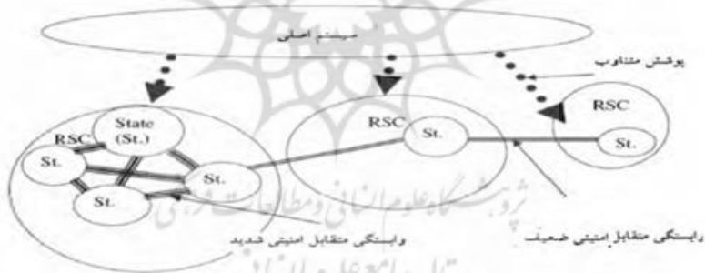
نمودار ۲. مدل مجموعه امنیتی بوزان

- مجموعه‌های امنیتی منطقه‌ای که در آن دولت‌ها و دیگر واحدها به‌اندازه‌ای به یکدیگر پیوند خورده‌اند که امنیت آن‌ها را نمی‌توان جدای از یکدیگر بررسی کرد (قاسمی، ۱۳۹۰، صص ۶۶-۶۷).