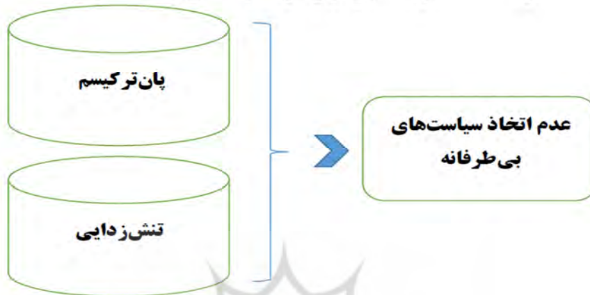
شکل شماره (۴): الگوی عدم بی‌طرفی حزب حرکت ملی ترکیه در قبال ایران

سیاست‌های بی‌طرفانه بر اساس شکل ۴ از سوی حزب حرکت ملی دنبال نمی‌شود. این حزب بر اساس رویکردهای هویتی خویش نمی‌تواند سیاست‌های بی‌طرفانه در قبال جمهوری اسلامی ایران و کشورهای منطقه داشته باشد.