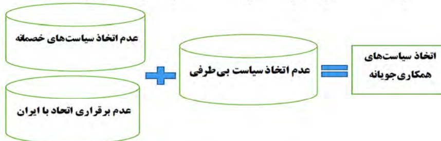
شکل شماره (۵): الگوی اولویت‌بخشی به همکاری حزب حرکت ملی ترکیه با ایران

حزب حرکت ملی بر اساس شکل ۵ سناریوی اتخاذ سیاست‌های همکاری‌جویانه را دنبال می‌کند. این رفتار سیاست خارجی به عنوان رفتار منتخب دانسته می‌شود. حالت‌های پیشین مواضع رفتاری حزب حرکت ملی را در قبال جمهوری اسلامی ایران نمی‌توانستند تبیین کنند.