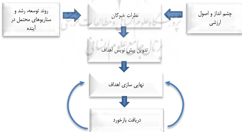
شکل ۱. مراحل تدوین اهداف کلان

یکی از روش‌های تدوین اهداف کلان سازمان‌ها، دریافت نظرات خبرگان هم‌راستا با چشم‌انداز و اصول ارزشی آن سازمان است. اهداف کلان؛ راهنماهای توسعه در سایر مراحل خواهند بود. بنابراین اهداف اولیه طراحی شده، برای نهایی شدن نیازمند تایید دوباره افراد متخصص هستند (باقری مقدم و همکاران، ۱۳۹۷: ۲۷۱). اجرای این مرحله به کاهش خطای ناشی از بازنویسی و پالایش اهداف توسط تحلیل‌گران کمک می‌کند. شکل زیر مراحل گرافیکی تدوین اهداف کلان را به طور خلاصه نمایش می‌دهد: