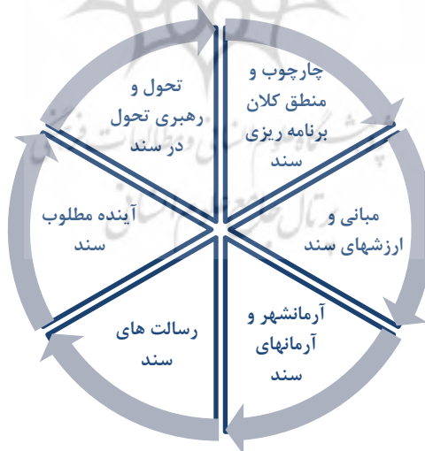
شکل ۳. مدل ساختاری الگوی اسلامی- ایرانی پیشرفت (عیوضی، ۱۳۹۵)

از بعد برنامه‌ریزی، الگوی پیشرفت تجلی خاصی از «برنامه‌ریزی بلندمدت» است که جریان آگاهانه انتخاب و تعیین اولویت‌ها به منظور تصمیم‌گیری آینده‌نگرانه را ترسیم و تبیین می‌نماید. در همین زمینه، یعنی برنامه‌ریزی راهبردی، مفهوم «آینده‌نگری» نیز قابل توجه است. به عبارت دیگر، در فضای تفکر راهبردی، مفهوم مرتبط با تصویرسازی، چشم‌اندازسازی و رویکردهای توصیفی راهبردی دارای اهمیت فراوانی است. براین‌مبنا، هرچند برنامه‌ریزی راهبردی به عنوان اجراکننده تفکرات راهبردی و در راستای به مرحله عمل رساندن راهبردهای حاصل از تفکر راهبردی می‌تواند نقشی حیاتی ایفا کند، آینده‌نگاری نیز به دلیل برخورداری ذاتی از تناسب لازم با ویژگی‌های تفکر راهبردی، در حجم گسترده‌ای به رفع نیازهای این سنخ تفکر قادر خواهد بود (کرامت‌زاده، ۱۳۸۷: ۱۳۵).