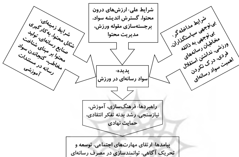
Figure 2. Paradigmatic pattern of Strauss and Corbin